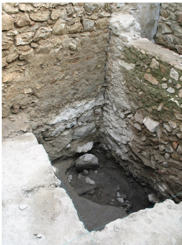
Figura 8: Sondagem III. Estrutura romana (U.E. [721]), muralha medieval (U.E. [208]) e barbaca dionisina (U.E. [15]).