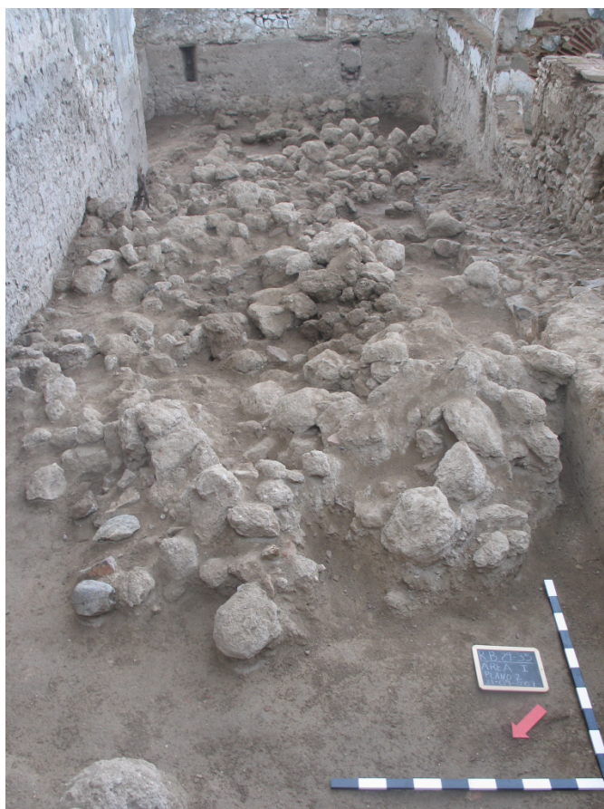
Figura 10: Área I. Derrube da muralha de taipa, barbacã dionisina (U.E. [15]) e reformulação de época moderna.