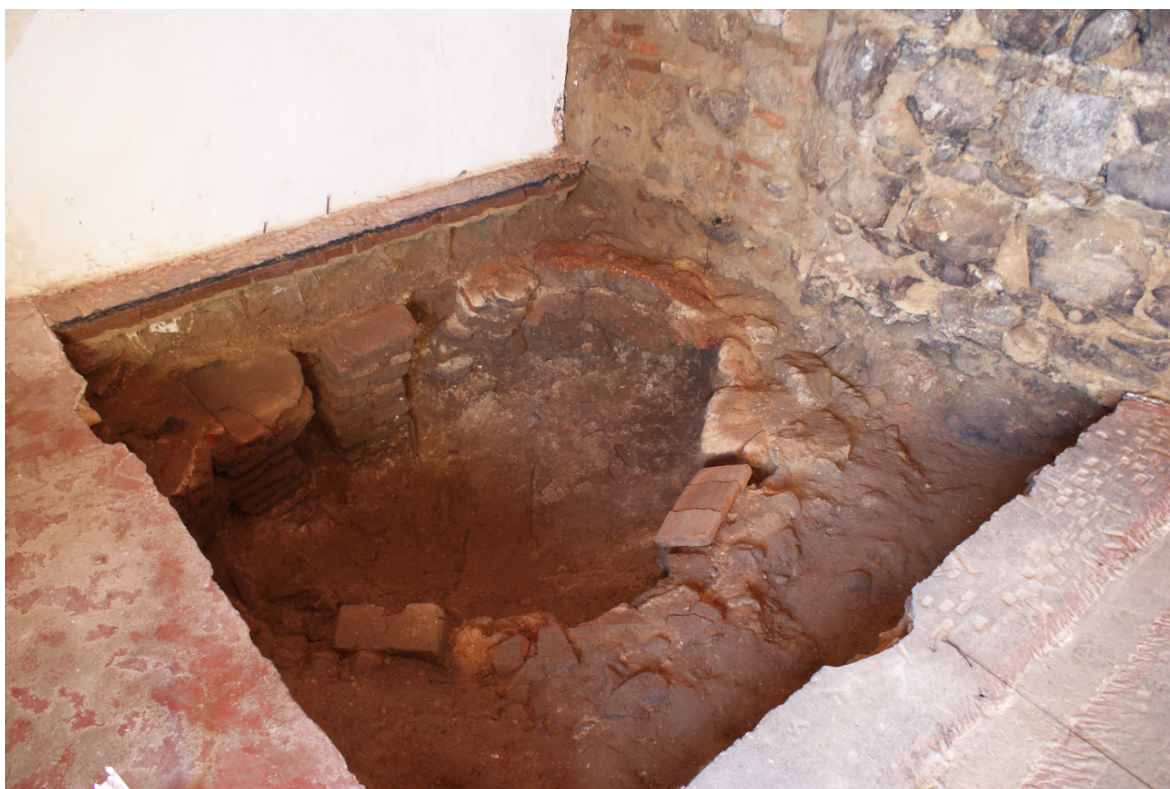
Figura 15: Sondagem II. Forno (U.E. [343]) de época moderna.