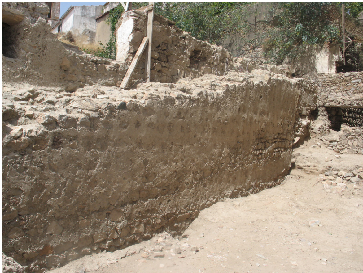
Figura 12: Área I. Face Este da barbaca dionisina (U.E. [15]).