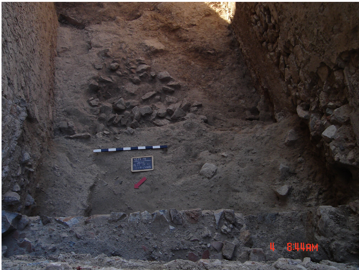
Figura 9: Área I. Muralha de taipa (U.E. [71]).