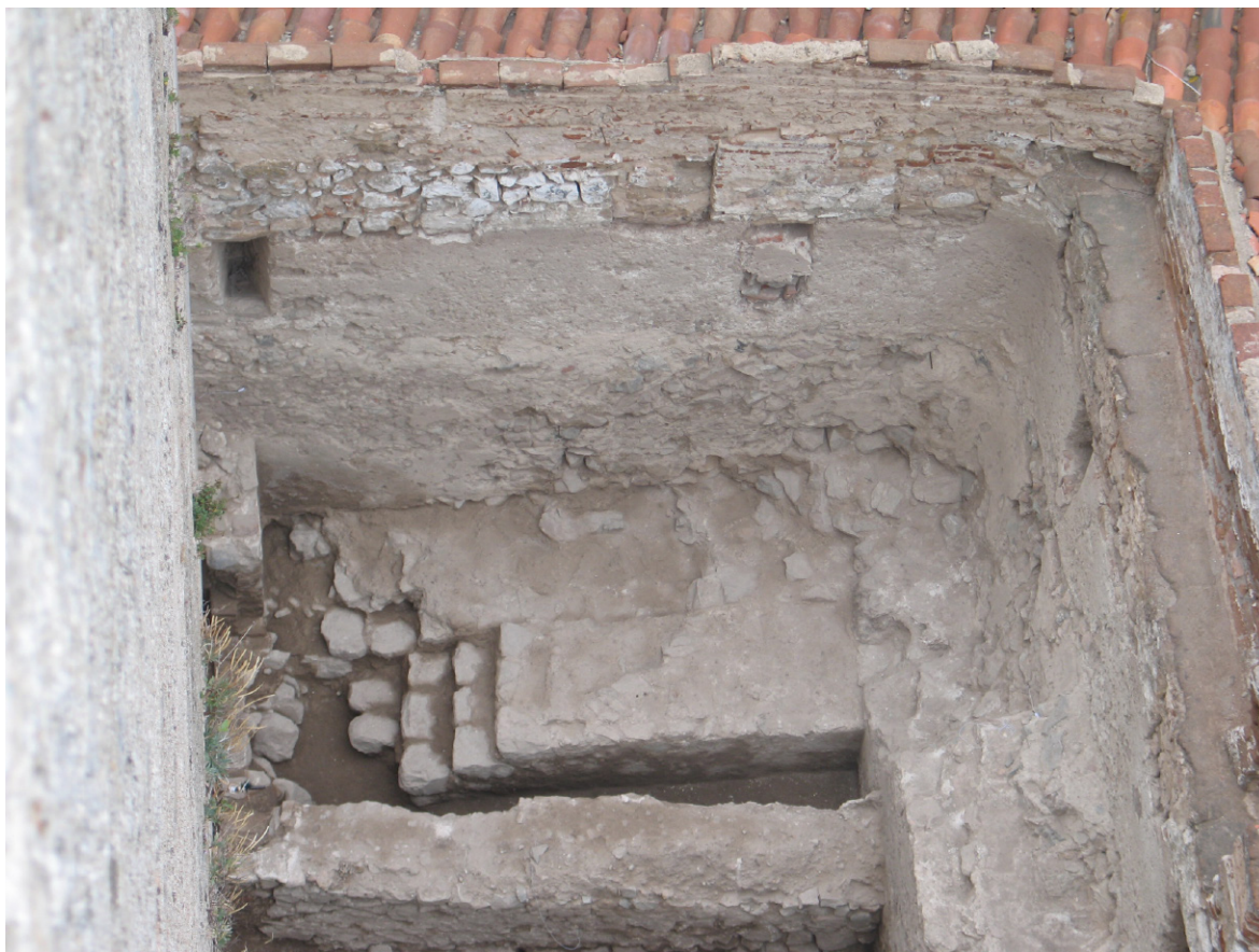
Figura 14: Área I. Alterações efectuadas na barbacã dionisina em época moderna.