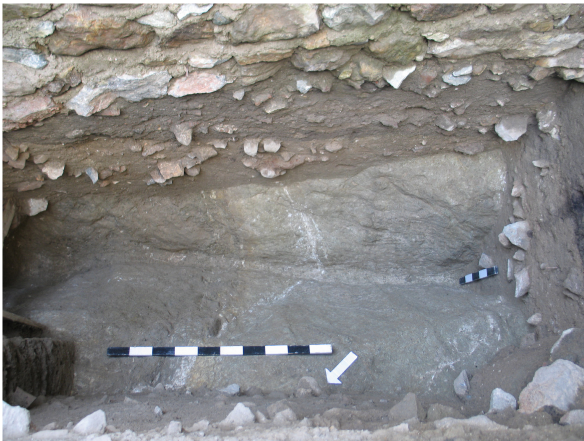
Figura 3: Sondagens I e I-A. Possível fosso (segmento inferior) da Idade do Ferro (U.E. [549]).