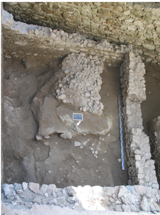
Figura 13: Área III. Compartimento III de época medieval e muralha medieval (U.E. [208]) cortada pela muralha manuelina (U.E. [187]), no topo.