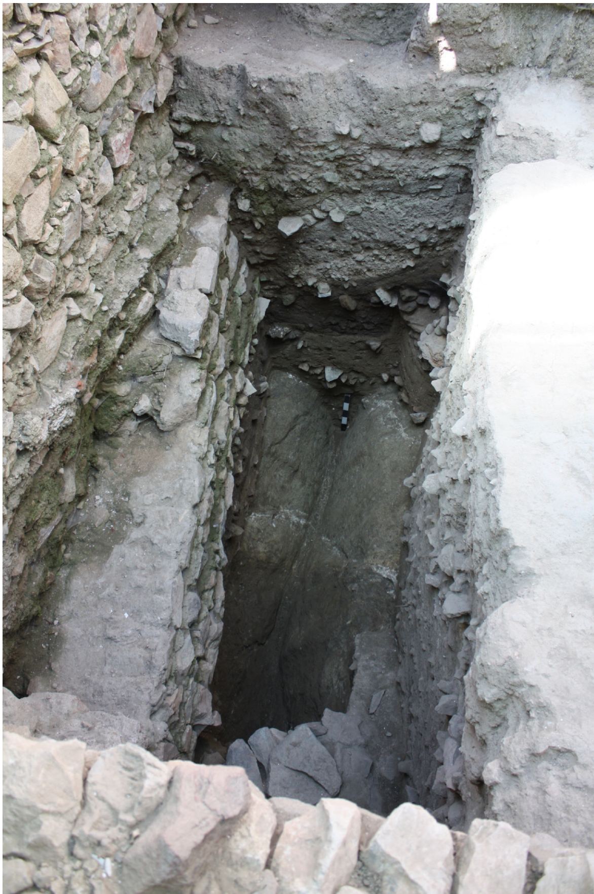
Figura 16: Sondagens I e I-A. Vista geral desde o compartimento III (medieval). Sobreposição da muralha manuelina (U.E. [187]) à muralha medieval (U.E. [208]). A cota inferior, muro (U.E. [367]) e possível fosso (U.E. [549]) da Idade do Ferro.