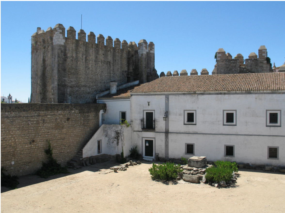
Figura 1: Alcáçova do Castelo de Serpa. Museu Municipal de Arqueologia (Casa do Governador) e Torre da Horta.