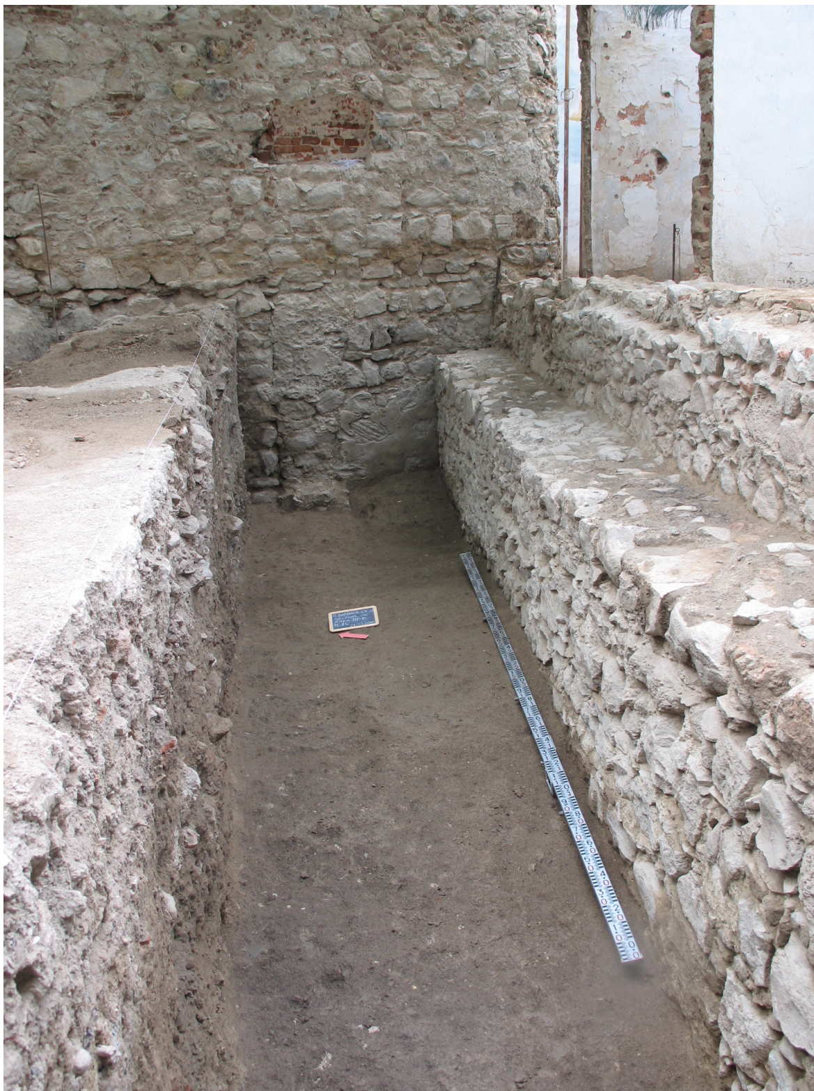
Figura 11: Área III. Muralha manuelina (U.E. [187]), à direita e muralha medieval (U.E. [208]) encastrada na barbacã dionisina (U.E. [15]), ao fundo.