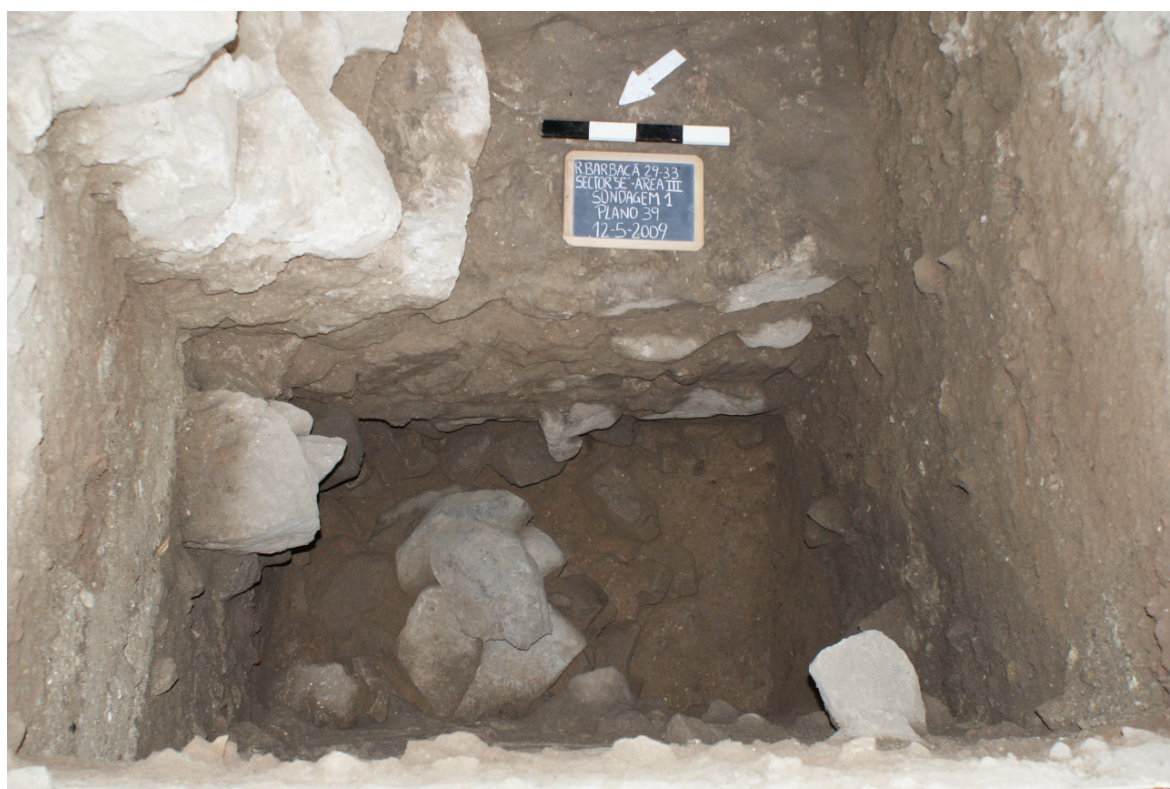
Figura 6: Sondagem I. Muro da Idade do Ferro (U.E. [367]), no plano a cota inferior; muro de época romana-republicana (U.E. [371]), no perfil Nordeste; muralha medieval (U.E. [208]) desmontada, no topo da imagem.