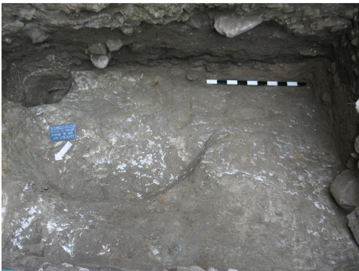
Figura 4: Sondagem III. Possível fosso da Idade do Ferro (U.E. [549]) e estrutura romana (U.E. [721]).