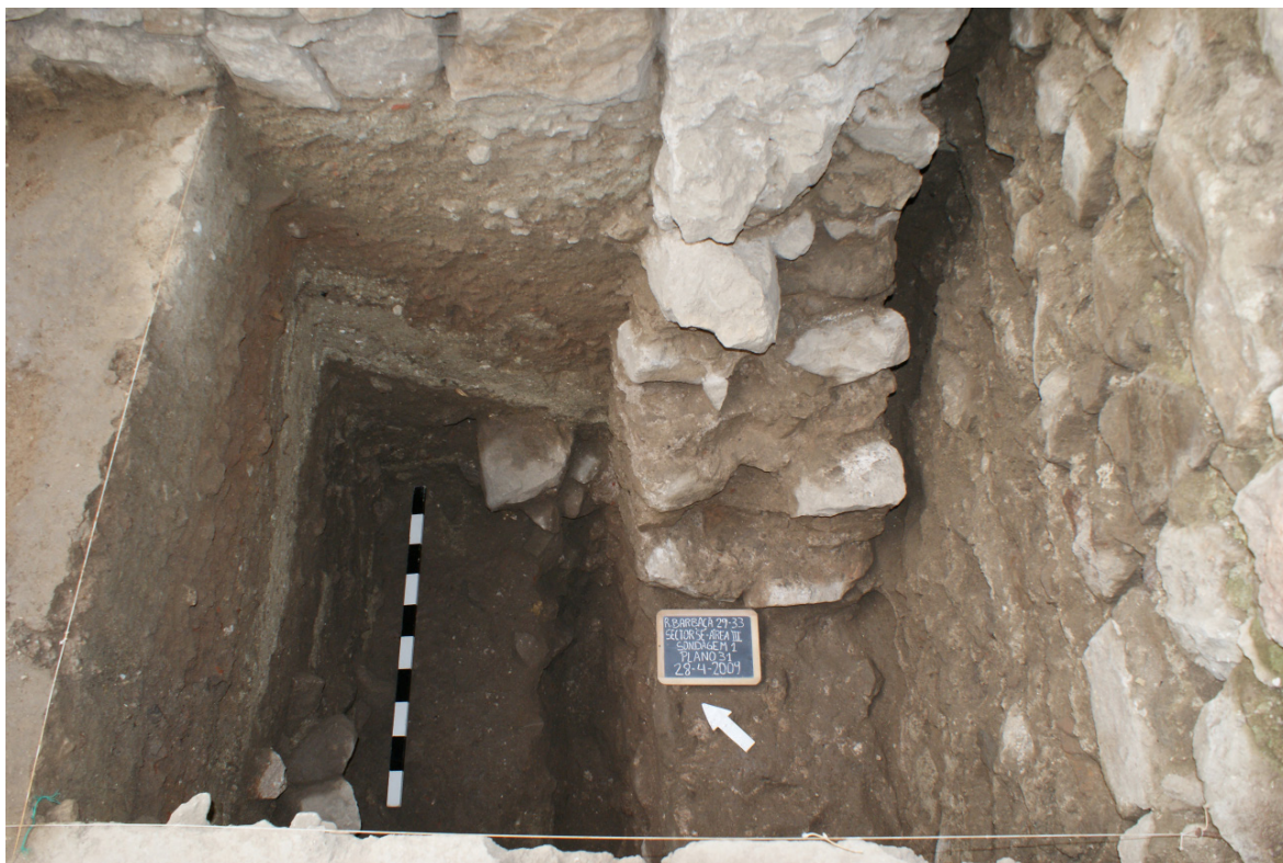
Figura 7: Sondagem I. Muro de época romana-republicana (U.E. [371]), no perfil Nordeste e muralha medieval (U.E. [208]) desbastada, no topo da imagem.