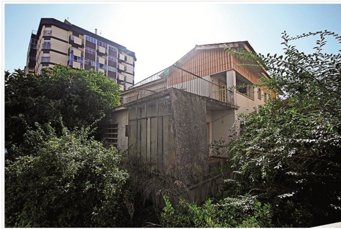
Ao abandono há vários anos, as antigas casas de função não escaparam à degradação

(Notícia publicada na edição de 30 de junho de 2016)