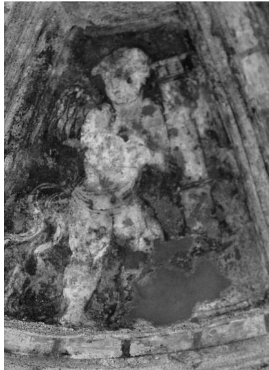
Fig. 18 Pormenor da decoração da cúpula - Palácio Ducal, Vila Viçosa.

fico e comunicacional faz deste caso um exemplo de referência.