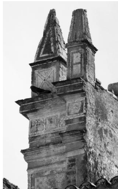
Fig. 15 Pormenor da decoração exterior dos alçados - Igreja Matriz de Safara, Moura.

da arquitectura erudita maneirista do Alentejo, cujo léxico transparece com clareza quer no traçado arquitectónico (que obedece ao modelo da igreja-salão) quer na excelente carga ornamental realizada, em argamassa de cal, com excepcional mestria (fig. 14 e 15). Os esgrafitos e os ornatos em massa – de cal e areia - surgem em composições a branco e areia com pequenos apontamentos a preto - com argamassa de cor negra - (fig. 16), o que torna esta decoração ainda mais extraordinária pela utilização de mais do que duas cores. A dimensão do monumento, a extensão da decoração, a excelente qualidade técnica de execução, assim como o facto de que a decoração deste monumento mantém a sua superfície original (isto é não está coberta de cal e/ou tintas) confirmam a necessidade de um projecto de conservação e a implementação urgente de medidas de protecção especiais. Note-se que no ano de 2001/02 a DGEMN realizou obras de conservação geral que previam a caiada da fachada principal. Hoje depois de caiada, não é possível observar se existem, embora caídos, vestígios desta decoração extraordinária, que era perceptível nas fotografias anteriores ao ano de 2000.