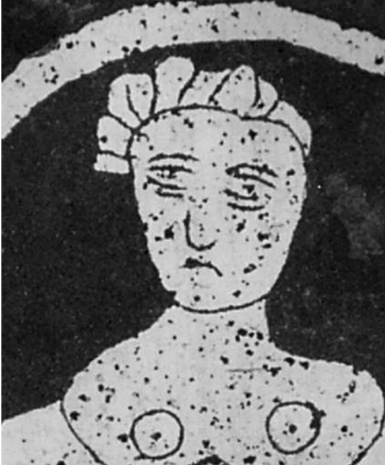
Fig. 13 Pormenor de uma das figuras centrais da decoração - Igreja de S. João Baptista, Amieira do Tejo.