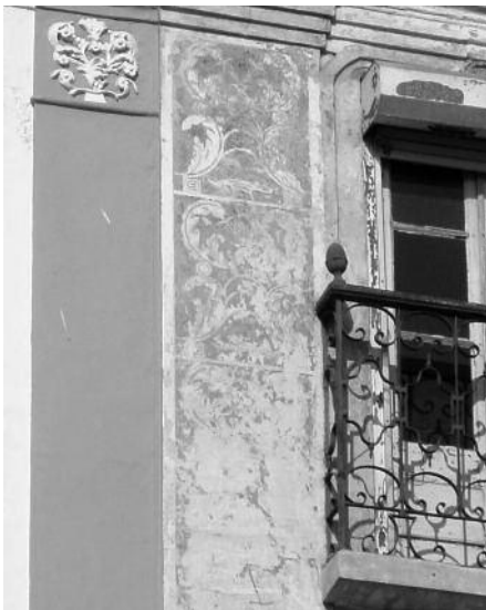
Fig. 23 Largo Luís de Camões, Évora.

Os inúmeros exemplos observados e já inventariados durante as investigações acima descritas permitem-nos concluir que o uso desta técnica permaneceu ininterrupta, nomeadamente no Alentejo, até aos inícios do século XX. Durante os séculos XVIII e XIX, no “auge da cultura urbana, a técnica de esgrafitar é amplamente utilizada, para explorar todas as suas potencialidades comunica-