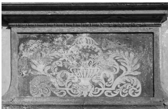
Fig. 32 Pormenor da decoração esgrafitada - Rua 5 de Outubro, Évora.