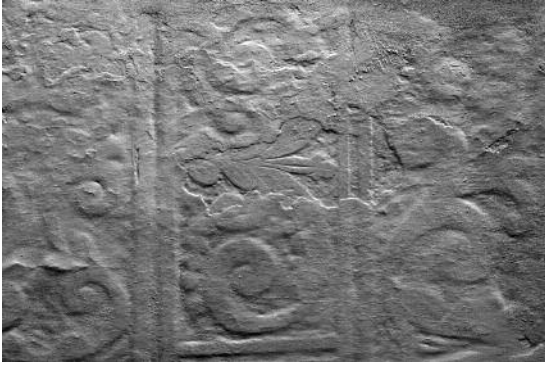
Fig. 26 Convento S. Francisco, Almodôvar.