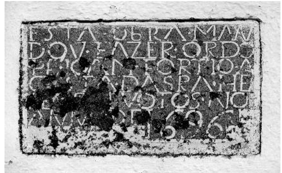
Fig. 2 Capela de Nossa Senhora de Entre Águas, Avis (argamassa avermelhada).