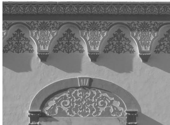
Fig. 25 Terreiro S. João de Deus, Montemor-o-Novo.

cionais, para exprimir uma intenção estética urbana de apresentação visual e comunicação arquitectónica” [6, p. 199]. Ainda, hoje, são visíveis diversos exemplos de esgrafitos nas cidades como Évora, Moura, Montemor-o-Novo, ou Vidigueira (fig. 23, 24 e 25).