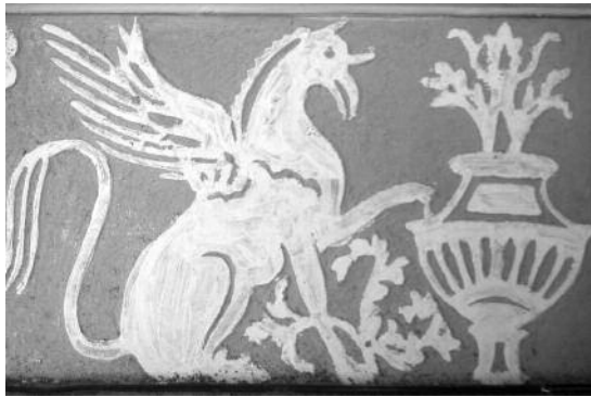
Fig. 27 Palácio dos Condes de Soure, Évora.