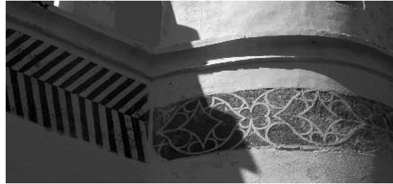
Fig. 4 Ermida de São Braz, Évora.

Durante as visitas efectuadas não nos foi possível observar qualquer vestígio esgrafitado na cornija, no entanto, este aspecto é importante de referir devido às semelhanças que encontramos com a Igreja de S. Brás. Os paralelismos entre a tipologia e a técnica decorativa desta Ermida e a de São Braz, faz-nos pressupor que os esgrafitos sejam contemporâneos da conclusão da capela, do século XVI, e que, não só era recorrente o modelo tipológico da Ermida de Évora, como também os seus formulários decorativos.