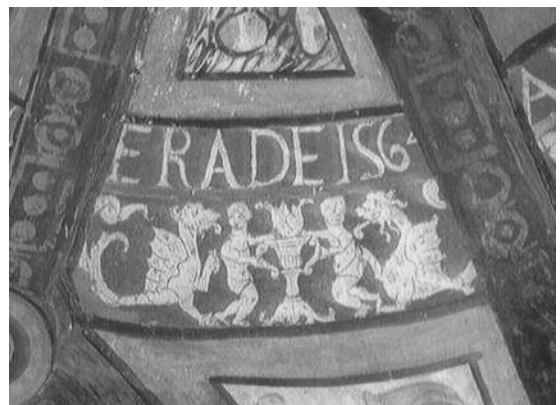
Fig. 9 Capela de Nossa Senhora da Redonda, Alpalhão.

Na capela-mor da Capela de Nossa Senhora da Redonda, em Alpalhão, os esgrafitos, datados de 1564, surgem em conjunto com uma decoração pictórica e circunscrevem-se a um anel circular bem demarcado na abóbada, com temas de animais fantásticos, querubins, figuras, meio humanas meio vegetalistas, e enrolamentos (fig. 9). Estes esgrafitos tem algumas semelhanças no programa iconográfico, assim como na técnica de esgrafitar, (ambas com a argamassa cor de areia como fundo), com os esgrafitos, datados de 1593, com motivos geométricos que emolduram a datação e a decoração mais figurativa, com temas zoomórficos, cruciformes e cabeças de anjo que decora a zona superior da parede sobre a