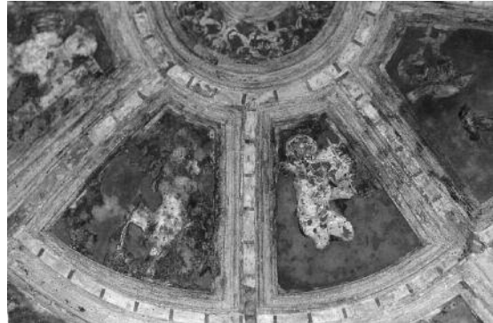
Fig. 17 Palácio Ducal (Templete no jardim), Vila Viçosa.