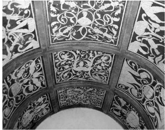
Fig. 11 Igreja de S. João Baptista, Amieira do Tejo.

Na Igreja de S. João Baptista, junto ao Castelo, na Amieira, é visível um notável revestimento esgrafitado a branco e negro, de estilo maneirista, inspirada em modelos eruditos, que reveste o tecto em abóbada, dividido em caixotões todos decorados por grotescos (fig. 11). Nestes esgrafitos onde os motivos vegetalista predominam podemos encontrar figuras antropomórficas e animais, que se conjugam, por vezes, em composições complexas, embora, mantenham um certo aspecto ingénuo (fig. 12 e 13) [10, p. 17]. O programa iconográfico desta capela foi objecto de uma análise comparativa com a Capela de Nossa Senhora da Redonda e com a Matriz do Crato por João Salgado Santos [10, p. 20]. As semelhanças entre os esgrafitos da Amieira e os da Matriz do Crato são evidentes: a mesma hierarquia do espaço e modo de distribuição iconográfica, a cor branca e negra da decoração e a existência de figuras idênticas. Estas figuras híbridas (meio humanas, meio vegetais) também estão presentes na capela de Nossa Senhora da