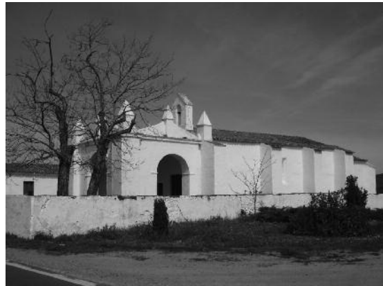
Fig. 5 Capela de Nossa Senhora das Represas, Cuba.