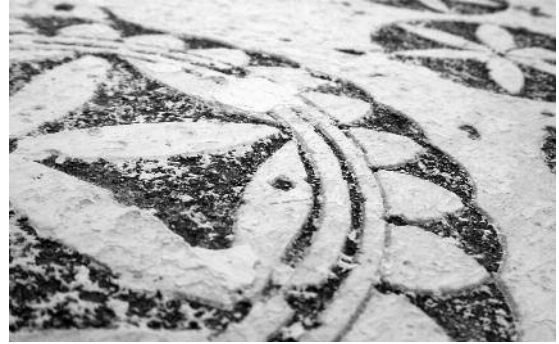
Fig. 1 Igreja de Santa Clara do Sabugueiro, Arraiolos (argamassa de cor cinzenta escura).

Usualmente, no esgrafito o primeiro plano é de coloração branca e textura fina. No(s) plano(s) subjacente(s), utiliza-se uma argamassa com uma textura mais áspera e colorida. Embora esta técnica utilize argamassas coloradas, geralmente, de cromatismo acinzentado através da adição de carvão ou palha cozida (fig. 1), de cor avermelhada pela utilização de tijolo partido (fig. 2), ou de coloração amarela/parda através do emprego de diferentes tipos de areia (fig. 3), a cor do esgrafito destaca-se, sobretudo, pelos efeitos bicromáticos de claro-escuro obtido pelo contraste entre as diferentes texturas, cores e sombras.