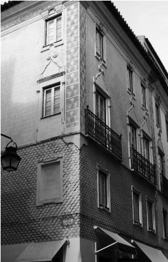
Fig. 33 Intervenção exemplar de conservação e restauro da superfície decorada da fachada na Rua 5 de Outubro, Évora.

A transposição destas exigências para os esgrafitos não é todavia simples. A grande diferença é a tridimensionalidade do esgrafito, porque a decoração ultrapassa a superfície “pintada”. No esgrafito, a argamassa de fundo é a superfície mais importante. É aquela que foi cortada, segundo as linhas do desenho e esgravatada em certas áreas. Sendo o esgrafito uma técnica decorativa com características de baixo-relevo, mas que mantém as qualidades intrínsecas de uma superfície pintada, talvez necessite do contributo e de uma nova conjugação das metodologias de restauro destas duas áreas e dos seus