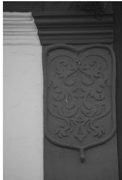
Fig. 29 Rua Manuel Joaquim da Silva, Redondo.

designadamente a qualidade dos rebocos que simulavam outros materiais mais nobres, o jogo cromático dos esgrafitos, a diferença entre o plano de fundo e o do ornato, os modos de dar mais ênfase à decoração e à qualidade do traço. Muitas destas acções de pintura deturpam e invertem a imagem do edifício e/ou do conjunto urbano e tem, por exemplo, transformado a cidade de Évora numa cidade branca e ocre, desprezando toda a sua riqueza cromática anterior (fig. 30).