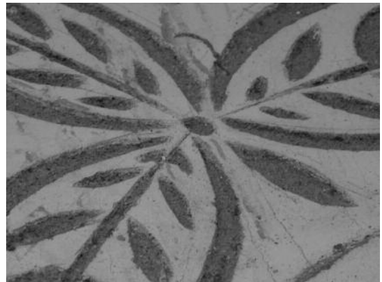
Fig. 3 Convento de S. Bento de Castris, Évora (argamassa de cor amarela / parda) .