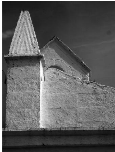
Fig. 6 Pormenor da decoração sob cal - Capela de Nossa Senhora, Cuba.