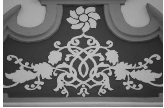
Fig. 28 Rua do Calvário, Redondo.