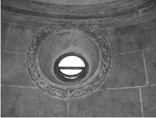
Fig. 19 Pormenor da decoração na parede - Palácio Ducal, Vila Viçosa

de conservação. A decoração esgrafitada, a branco e areia, reveste a totalidade das paredes, com motivos vegetalistas e de grotescos, traduzindo uma clara filiação renascentista de grande qualidade de execução (fig. 20 e 21). A singularidade deste caso deve-se ao facto da decoração esgrafitada se estender a toda a superfície interior ultrapassando o apontamento decorativo e, também, pelo esgrafito ter sido utilizado na decoração e simulação de pilastras (fig. 22). Estas características fazem, deste caso, um singular exemplar da técnica de esgrafitar digno de classificação.