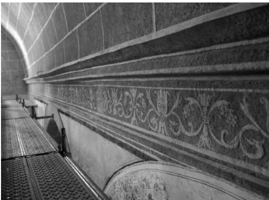
Fig. 20 Igreja do Espírito Santo, Arronches.

Podemos concluir perante os muitos casos inventariados durante a nossa pesquisa, sobre os esgrafitos no Alentejo e durante o estudo realizado sobre os esgrafitos em Évora [13], alguns dos quais aqui apresentados, que a técnica predominante no Alentejo é a do esgrafito