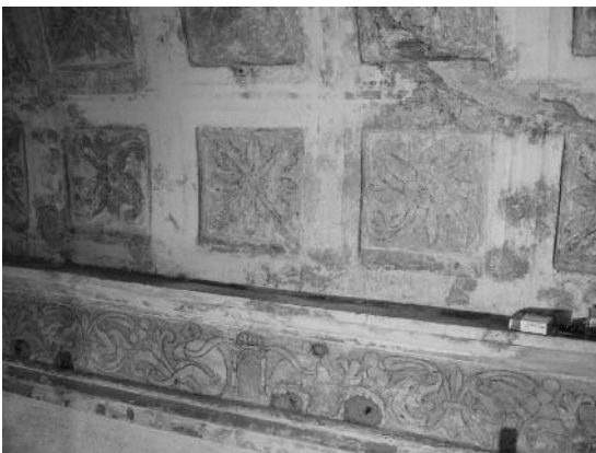
Fig. 7 Igreja de Nossa Senhora da Assunção, antiga Sé de Elvas.

Numa pequena divisão, junto ao coro alto da Igreja de Nossa Senhora da Assunção, antiga Sé de Elvas, existe uma curiosa decoração, renascentista, esgrafitada, com figuras estilizadas e edículos concheados e abóbada com motivos florais, onde é possível observar um curioso contorno mais escuro das figuras (fig. 7). Conjuntamente com este risco surge um ponteadado escuro nos limites do desenho. Numa primeira análise podia interpretar-se como uma obra não terminada, onde era visível, sobre a decoração, o ponteadado resultante da transferência do desenho do ornato para a superfície, pelo processo de estresido. No entanto, uma observação mais atenta da forma como estes riscos mais escuros enfatizam todo o desenho do ornato, dando mais relevo e contraste ao esgrafito (fig. 8), cuja diferença entre o plano de fundo e o