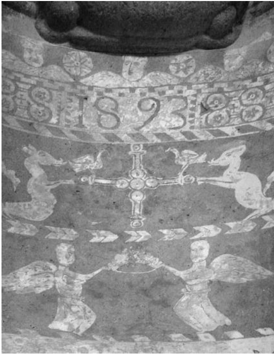
Fig. 10 Capela de Nossa Senhora do Rosário - “Catedral” de Idanha-a-Velha.

cobertura em concha da Capela de Nossa Senhora do Rosário, na chamada “Catedral” de Idanha-a-Velha (fig. 10).