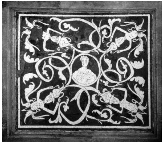
Fig. 12 Pormenor da decoração esgrafitada - Igreja de S. João Baptista, Amieira do Tejo.

Redonda, pelo que se pressupõe que estas composições tenham recorrido às mesmas gravuras, “o que reforça a teoria da circulação de desenhos entre os vários focos de produção artística” [10, p. 17]. As figuras de grotescos presentes na Amieira foram sempre utilizadas ao longo dos tempos, pelo que é difícil datá-las de forma conclusiva. Patrícia Monteiro afirma que serão provavelmente já dos finais do século XVI ou inícios do XVII.