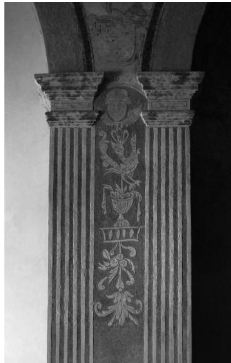
Fig. 22 Pormenor da pilastra - Igreja do Espírito Santo, Arronches.