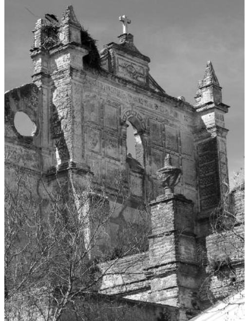
Fig. 14 Aspecto geral da fachada posterior da Igreja Matriz de Safara, Moura.

da arquitectura erudita maneirista do Alentejo, cujo léxico transparece com clareza quer no traçado arquitectónico (que obedece ao modelo da igreja-salão) quer na excelente carga ornamental realizada, em argamassa de cal, com excepcional mestria (fig. 14 e 15). Os esgrafitos e os ornatos em massa – de cal e areia - surgem em composições a branco e areia com pequenos apontamentos a preto - com argamassa de cor negra - (fig. 16), o que torna esta decoração ainda mais extraordinária pela utilização de mais do que duas cores. A dimensão do monumento, a extensão da decoração, a excelente qualidade técnica de execução, assim como o facto de que a decoração deste monumento mantém a sua superfície original (isto é não está coberta de cal e/ou tintas) confirmam a necessidade de um projecto de conservação e a implementação urgente de medidas de protecção especiais. Note-se que no ano de 2001/02 a DGEMN realizou obras de conservação geral que previam a caiada da fachada principal. Hoje depois de caiada, não é possível observar se existem, embora caídos, vestígios desta decoração extraordinária, que era perceptível nas fotografias anteriores ao ano de 2000.