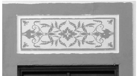
Fig. 35 O mesmo vão após ter sido objecto de uma intervenção acrílica de pintura dos esgrafitos – Rua 5 de Outubro, Évora.

conhecimentos específicos para a definição de soluções e técnicas de conservação.