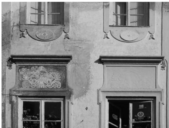
Fig. 31 Rua 5 de Outubro, Évora.

Perante a dimensão deste fenómeno adulterador é necessário equacionar os seus impactes, tanto ao nível urbano e da sua implicação negativa na imagem das cidades históricas, como ao nível do objecto, nomeadamente da necessidade de uma efectiva conservação face à opção acrítica de pintar, com a conseqüente perda de expressividade do ornato, alteração cromática e perda de autenticidade material (fig. 31 e 32).