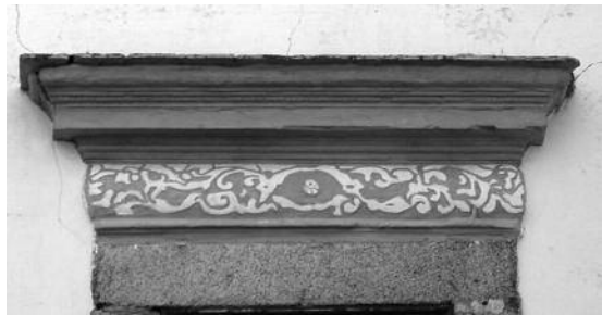
Fig. 30 Paço dos Bispos Inquisidores, Évora.

Camadas exageradas de pintura escondem a superfície, alteram a textura e a cor original do esgrafito (fig. 26 a 30), resultando geralmente numa falta de detalhe na decoração, anulando as linhas de incisão e de corte, assim como a textura da argamassa e alguns pormenores do desenho do esquema decorativo. É importante enfatizar, a este propósito, que os valores da autenticidade de material adquirem maior peso nas superfícies arquitectónicas com reboco à vista, como são os esgrafitos, as