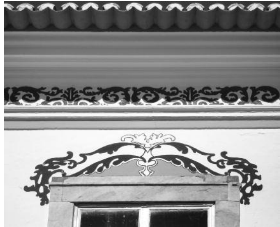
Fig. 24 Rua 5 de Outubro (Os Leões), Moura.