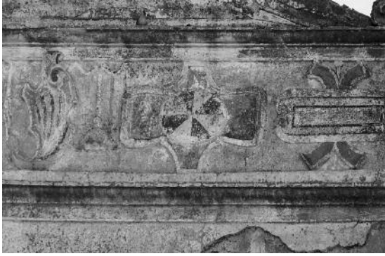
Fig. 16 Pormenor da decoração onde é visível a utilização complementar da cor preta - Igreja Matriz de Safara, Moura.