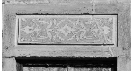
Fig. 34 Na mesma rua, Rua 5 de Outubro, Évora – pormenor antes da intervenção de pintura.