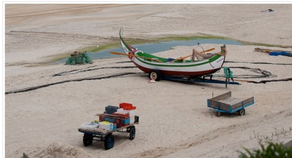
Petição na internet apela à valorização e divulgação da arte xávega por parte do município

(Notícia publicada na edição de 21 de julho de 2016 e editada)