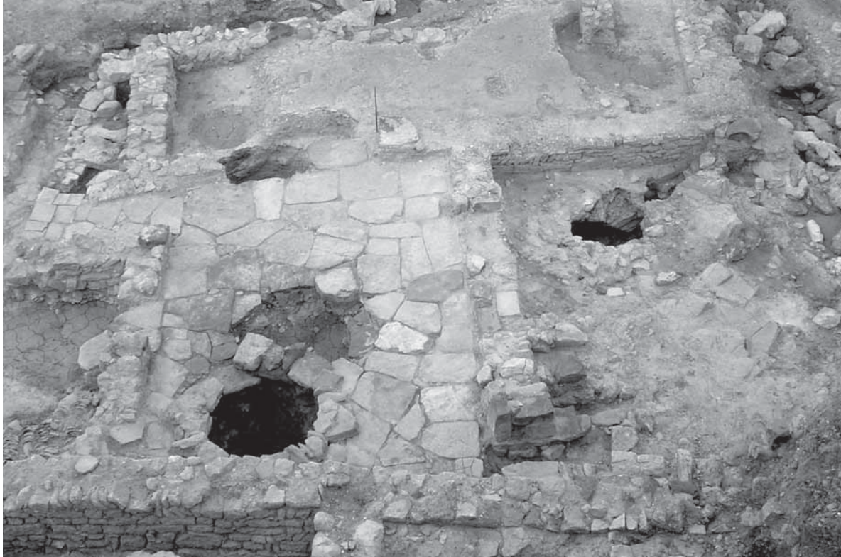
Vista geral da Casa I do bairro almóada do Convento da Graça

No Terreiro do Parguinho foram escavados restos de uma estrutura habitacional de época almóada (Mateus, 2009: 55), tendo sido exumadas diversas cerâmicas, de que se destaca uma pia de abluções em corda seca total, talhas estampilhadas e vidradas a verde e cântaros com pintura a óxido de ferro, para além das demais formas (alguidares, talhas, candeias de câmara aberta, caçoilas ditas de costillas , etc. ( Ibidem , 46-51).