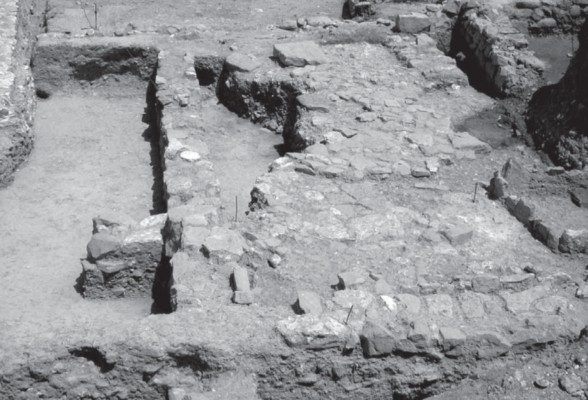
Pormenor do arrabalde da Bela Fria

Este arrabalde estender-se-ia até à Ermida de S. Roque, nas imediações da Bela Fria, onde recentes trabalhos arqueológicos puseram a descoberto estruturas arqueológicas, datadas do período almóada através das cerâmicas exumadas, nomeadamente, fragmentos de cântaro com pintura a vermelho (Covaneiro e Cavaco, 2010).