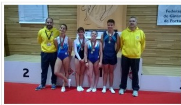
Trampolins Clube de Leiria