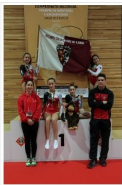
Ateneu Desportivo de Leiria