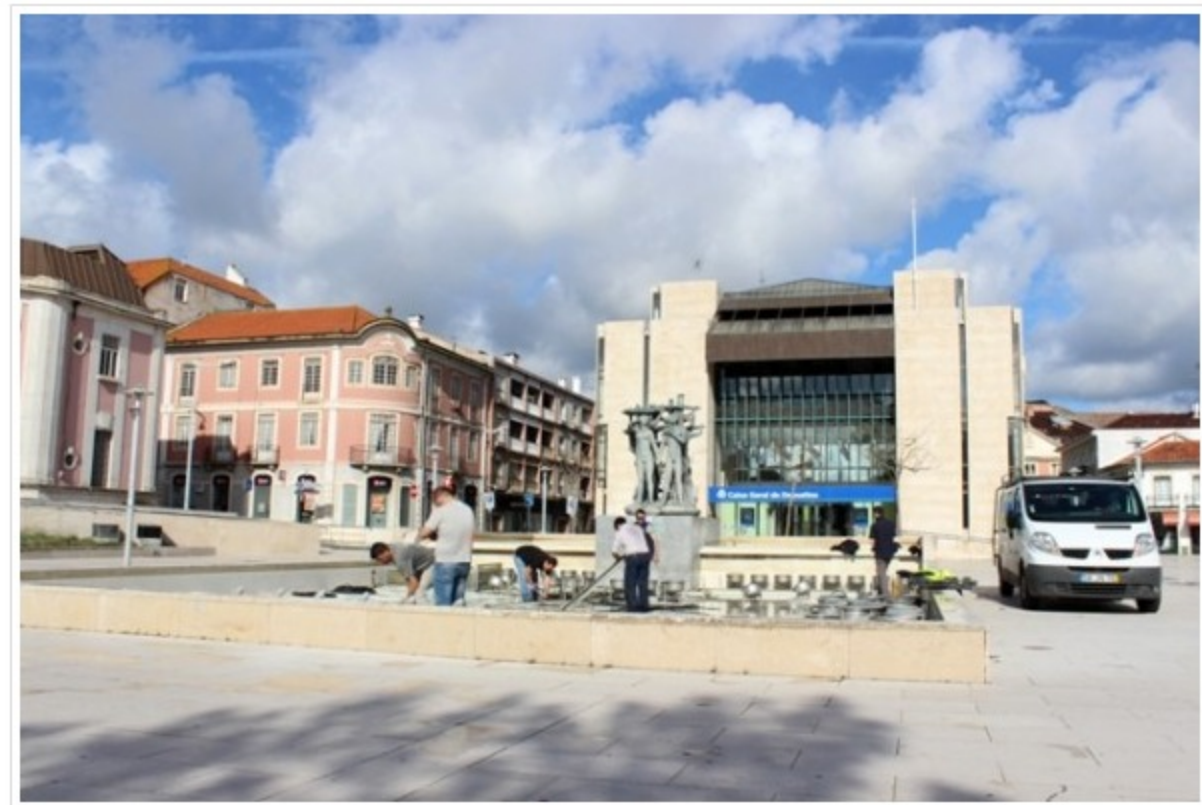
Primeiros trabalhos já começaram