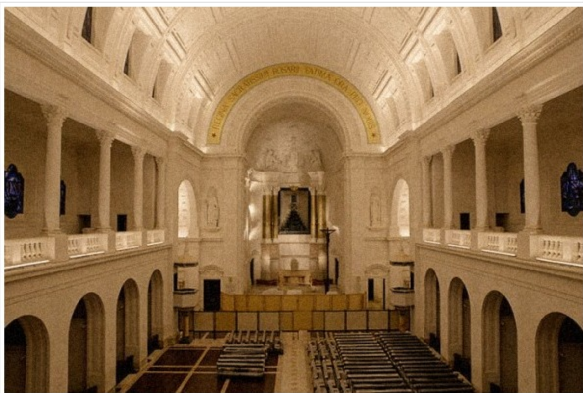
Intervenção demorou ano e meio

Ainda de acordo com os serviços de comunicação do Santuário, também o órgão da Basílica de Nossa Senhora do Rosário, instalado no coro alto, foi sujeito a uma profunda re-estruturação levada a cabo pelos organeiros da Mascioni Organi.