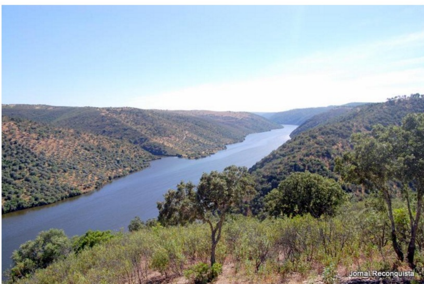
A visita vai passar por vários concelhos atravessados pelo Tejo.

A Comissão Parlamentar de Ambiente da Assembleia da República está a realizar até quarta-feira uma visita a vários concelhos atravessados pelo rio Tejo.