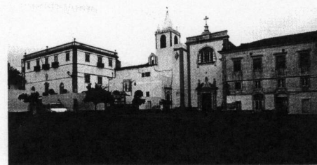
Vila de Avis (DB)

O território de eleição da milícia viria a situar-se, no entanto, na região definida pela bacia hidrográfica do Sorraia, mais afastada da fronteira. Era aí que se localizava o Castelo de Coruche, algumas das comendas mais antigas e muitas das vilas que haviam sido povoadas por iniciativa da Ordem. No centro desse espaço, quase a meia distância entre Évora e