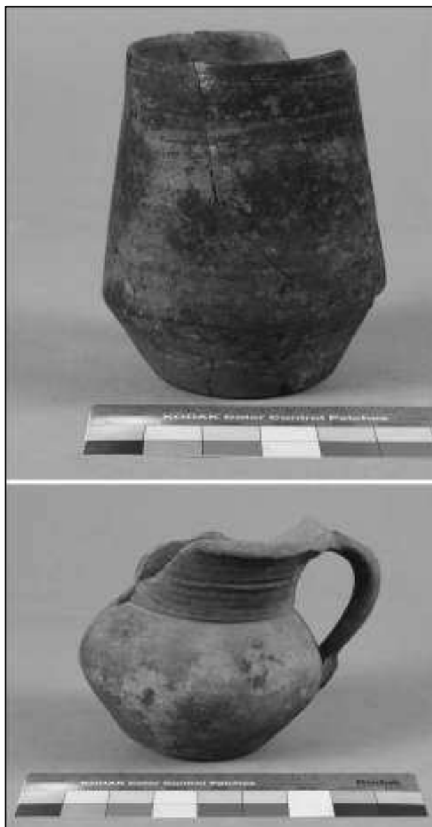
Fig.4 Peças recolhidas nos silos no interior da habitação (B)

A datação desta fortificação provém de um estudo comparativo, realizado por Pavón Maldonado (1993: 19-25), deste método construtivo com outros recintos murallados peninsulares, considerados de época muçulmana, o que levou a que concluísse que esta construção se situasse entre os séculos IX-X, tendo permanecido esta opinião até ao momento (VVAA 1998a: 201; Coelho 2000: 210-214 e 2002: 390-393), embora se tenham evidenciado as sucessivas reconstruções atribuídas à conquista cristã e às intervenções de D. Fernando II (Correia de Campos 1965: 140-141; Pavón 1993: 20- 25; Coelho 2000: 210 e 2002: 390-391).