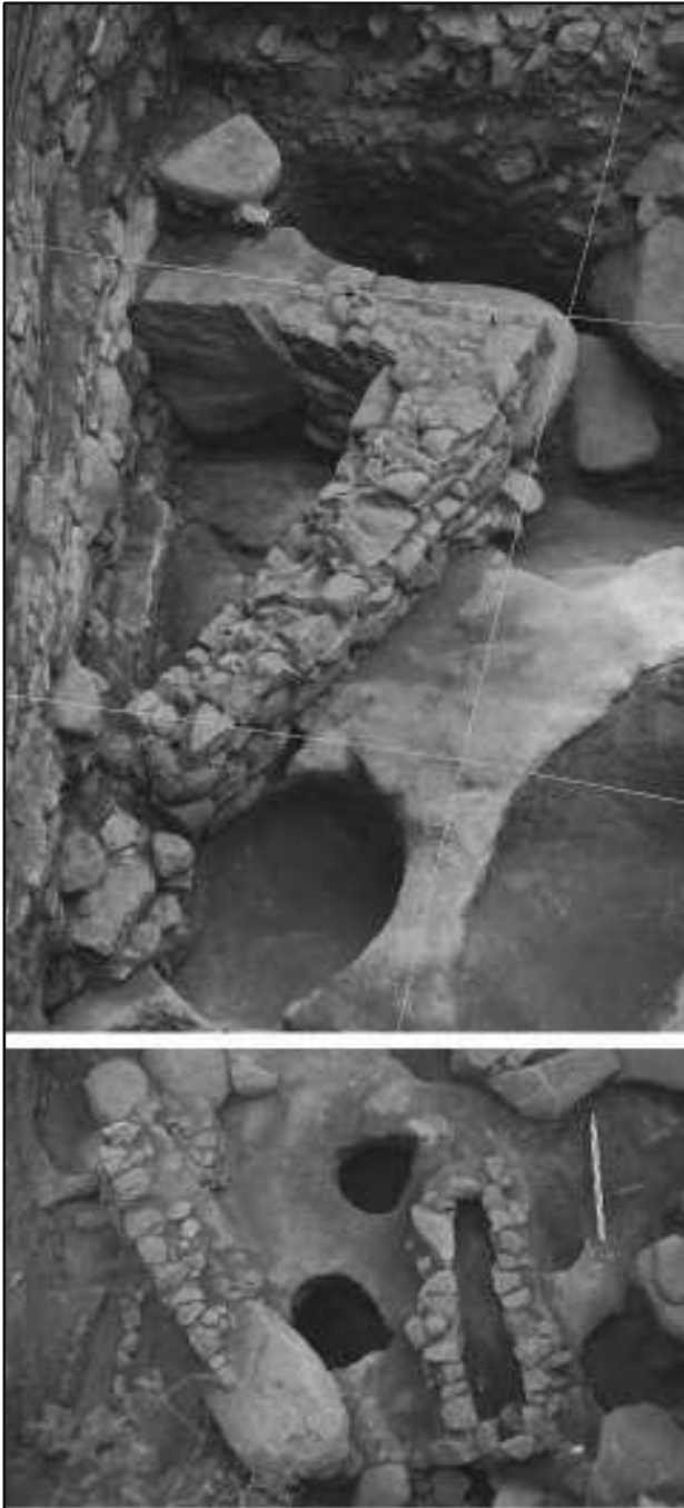
Fig.2 A – Interior da Cavalariça Norte onde se observa parte da habitação sob a muralha; B – Vista exterior da muralha, onde se observa a continuação da habitação, silos e sepulturas. (créditos fotográficos A – Maria João de Sousa/PSML B – Alexandre Fernandes/PSML).

Para além destes, junto à muralha identificaram-se muros de um compartimento com orientação N-NE e O-SE, os quais fazem uso de um bloco granito para a sua edificação, configurando uma esquina sob a qual assenta o pano de muralha Este. (Fig. 2)