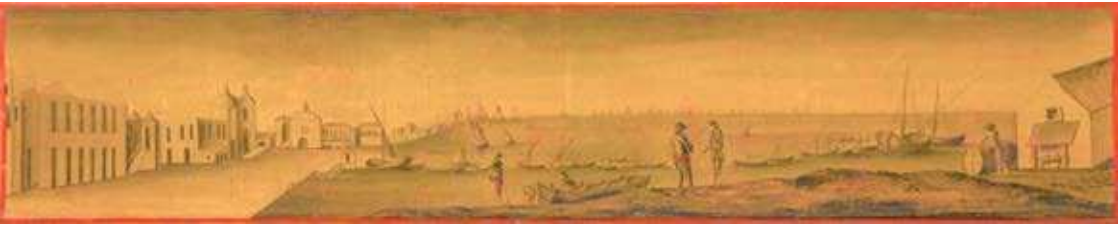
Figura 6. Em primeiro plano, à direita na imagem, o que seria o Alto da Morraça. Detalhe do plano do terreno que circunda o armazém da pólvora construído nos subúrbios de Faro, por José de Sande Vasconcelos, em 1786.

Concluindo, a praça da Ribeira e o núcleo medieval, neste quadro de circunstâncias, tornaram-se espaços nobres e imponentes onde não tinha cabimento as atividades malcheirosas, como a salmoura e a secagem do peixe, bem como o ruído produzido por vendedores, compradores e pregoeiros. Por estas razões, e também por questões de salubridade, os mercados do peixe, da fruta, legumes, pão e carne foram afastados das ruas e das áreas mais centrais da cidade confinando-os, cada vez mais, à periferia do espaço da praça da Ribeira, junto à linha de água, nas proximidades do sítio denominado Alto da Morraça( fig. 6) 60 .