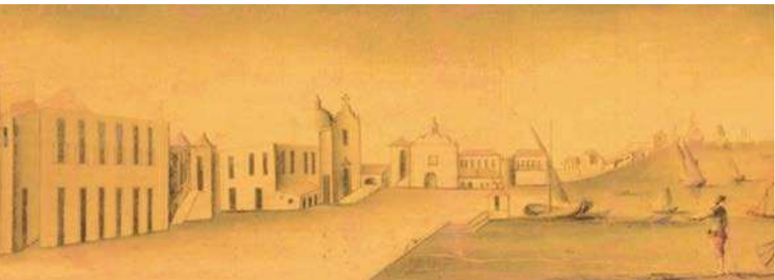
Figura 3. Plano do terreno que circunda o armazém da pólvora construído nos subúrbios de Faro, por José de Sande Vasconcelos, em 1786.

As atas de vereação do século XIX indicam que era costume vender e salgar o peixe entre o pelourinho (em frente ao Hotel Faro) 46 , e o Paço 47 (Armazém das Reais Pescarias, onde se encontra a Alfândega), pelo que conseguimos ter a perceção da mudança que ocorrera entre os finais do século XVI e inícios do XVII, sendo claro que o mercado, (i. e., os vendedores de peixe) foi retirados do centro para os subúrbios de então. Os vendedores de frutas, legumes, carne e pão que se localizavam intramuros, como vimos, perto dos Paços do Concelho, parecem ter abandonado esta área, ainda em finais do século XV, para acompanharem a expansão urbana, estabelecendo-se nas zonas mais concorridas do arrabalde. Aliás, o espaço a poente da atual Praça Ferreira de Almeida, onde atualmente se localiza a