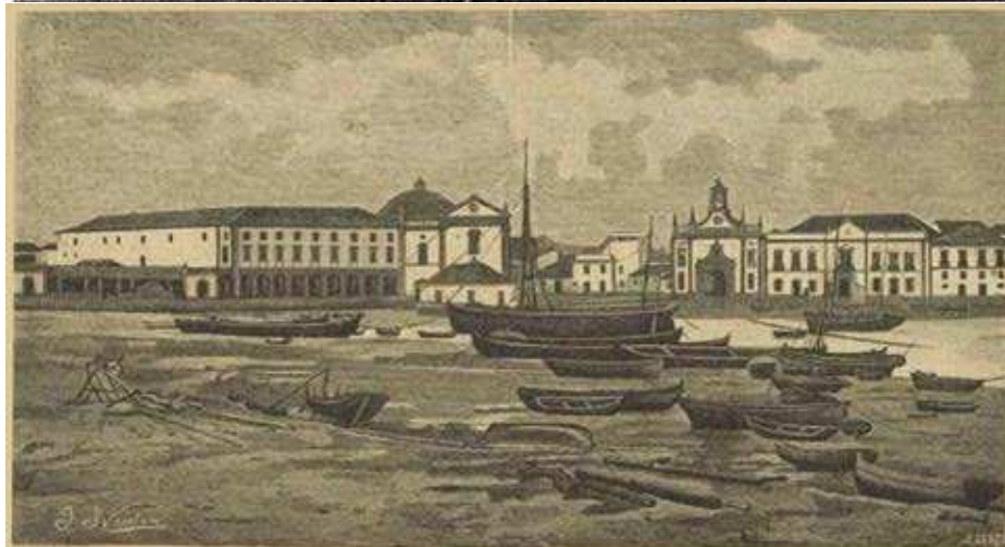
Figuras 4 e 5. Representações da cidade de Faro datadas do século XVIII (imagem superior) e XIX (imagem inferior) com a Praça e o Arco da Vila em destaque.