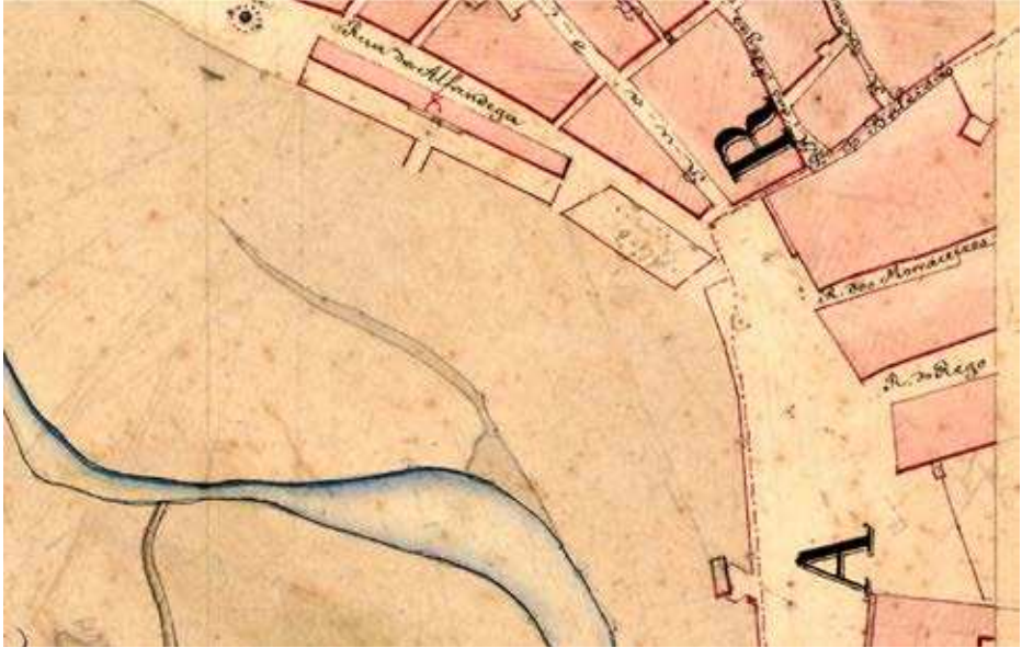
Figura 7. Sinalização do Mercado de Peixe, no Plano Hidrográfico das Barras e Portos de Faro e Olhão, elaborado entre 1869 e 1872, por Bento Maria Freire de Andrade.

espaciais, aquela área definida em 1845, para a comercialização do peixe, encerrava um espaço retangular, nas proximidades da Alfândega, mas não à frente desta, tal como foi registado posteriormente no levantamento do Plano Hidrográfico das Barras e Portos de Faro e Olhão, elaborado entre 1869 e 1872, com legenda esbatida a dizer: mercado peixe (fig. 7) 68 .