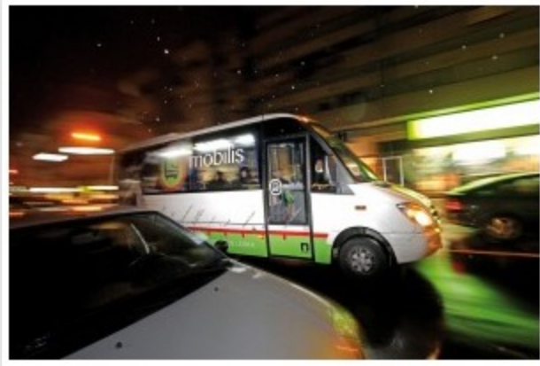
Subscritores pedem autocarros da cidade para a periferia

“Lá fora, em países mais desenvolvidos, a tolerância a comportamentos de risco é zero, mas a oferta de meios de transporte é de 100%”, conclui no documento dirigido à Câmara e à Rodoviária do Tejo.