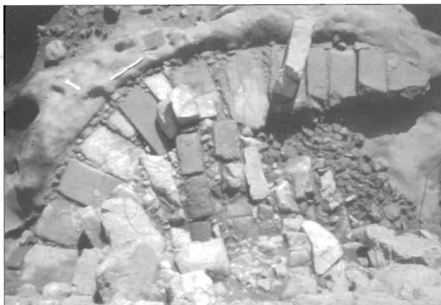
Fig. 5 – Fotografia dos alicerces do torreão da muralha romana do Fujacal.