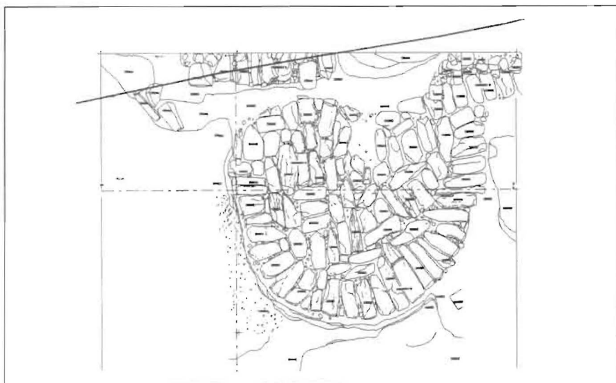
Fig. 7 – Desenho do torreão da Rodovia.