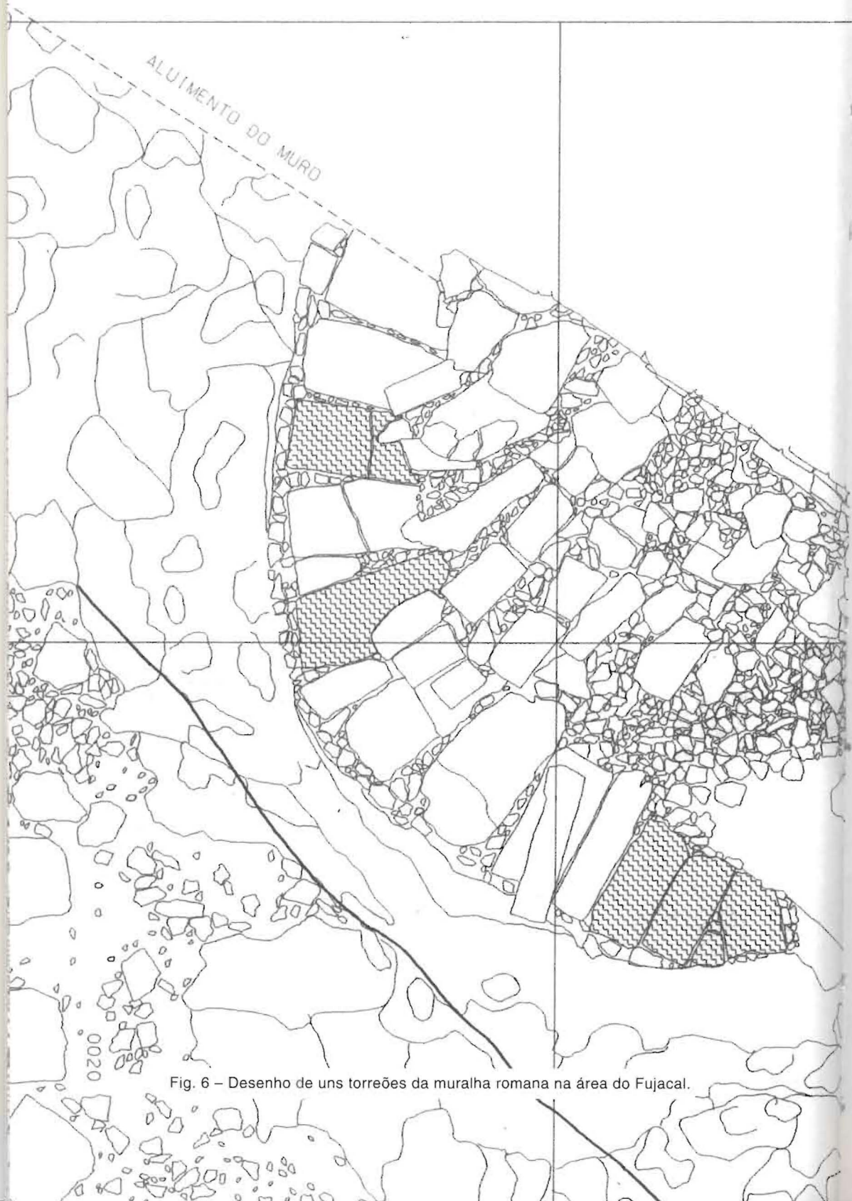
Fig. 6 - Desenho de uns torreões da muralha romana na área do Fujacal.