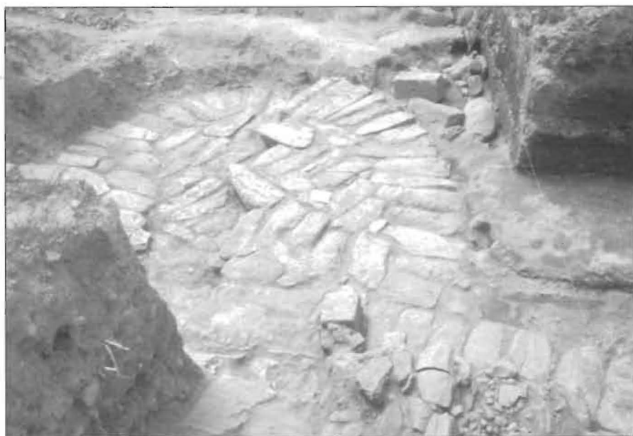
Fig. 8 – Alicerce do torreão da Rodovia (Av. Imaculada Conceição).