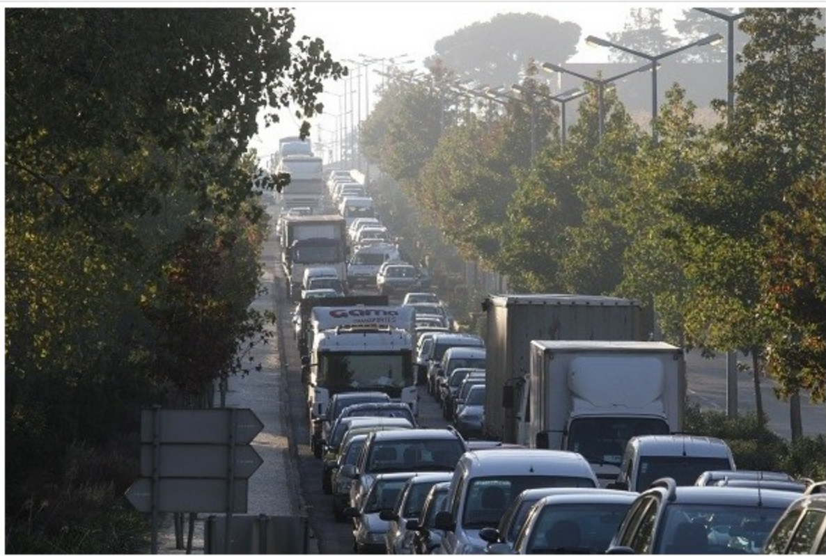
O distrito está nas primeiras seis posições nos diferentes segmentos de veículos

Há mais 0,6% de veículos a circular do que em 2014 - com a Renault, Opel e Volkswagen na liderança -, e a média de idades é agora de 12,4 anos. Um quarto dos carros ligeiros (25,1%, mais de um milhão) tem entre 10 e 15 anos. Apenas 3,6% tem até um ano.