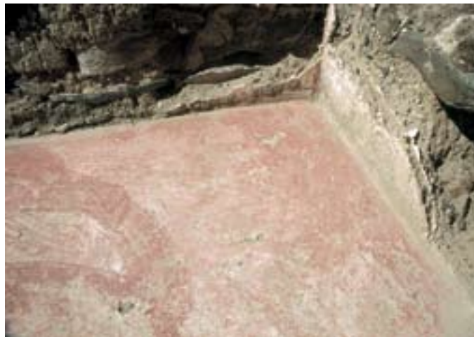
Pavimento argamassado da casa IV.