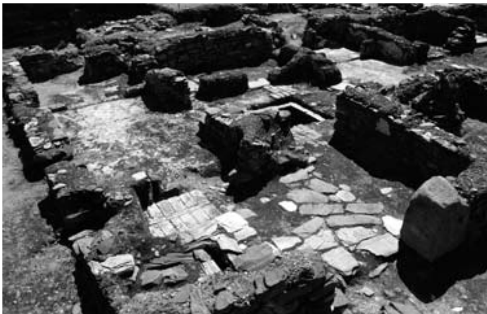
Casa X, vista geral.