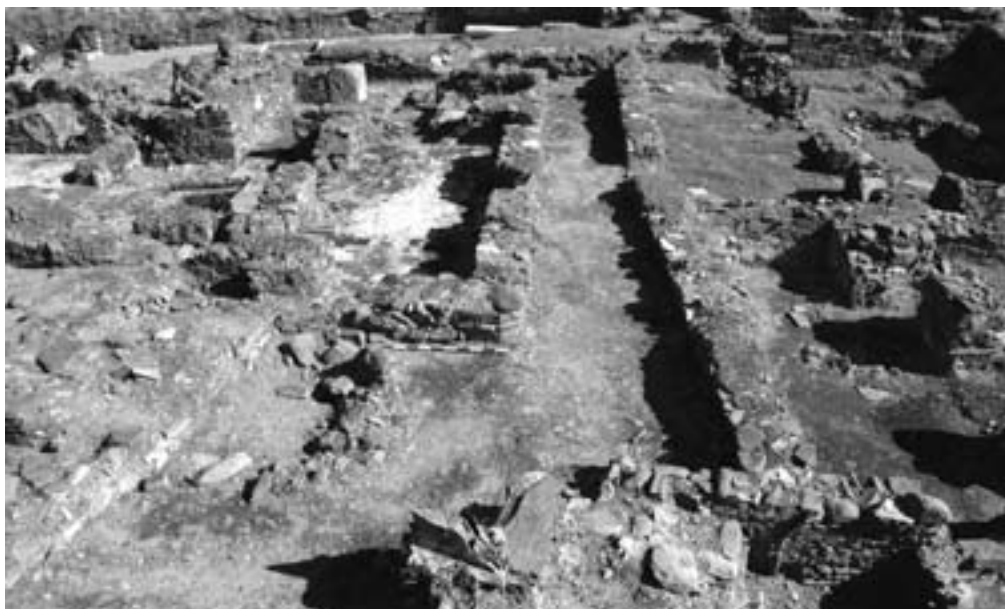
Adarves 1 (à esquerda e em baixo) e 2 (à direita) do bairro.