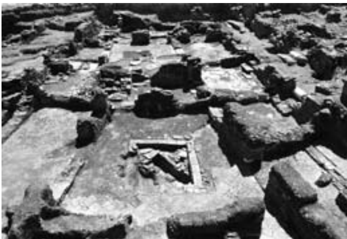
Casas I e II (vista geral).

O bairro da alcáçova é uma obra notável de planeamento, com um traçado de ruas e a concepção de sistemas de saneamento, que nada têm a ver com improvisos ou com uma qualquer obra do acaso. A rede viária organizava-se, na extensão até agora posta a descoberto, segundo um esquema definido de forma algo tosca mas onde os eixos delineados em linhas perpendiculares entre si são, ainda hoje, e após as escavações arqueológicas, perfeitamente definíveis. A área habitada era estruturada por duas ruas que delimitavam a alcáçova a norte e a oeste.