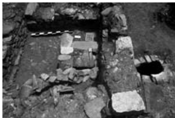
Fossa da casa V.