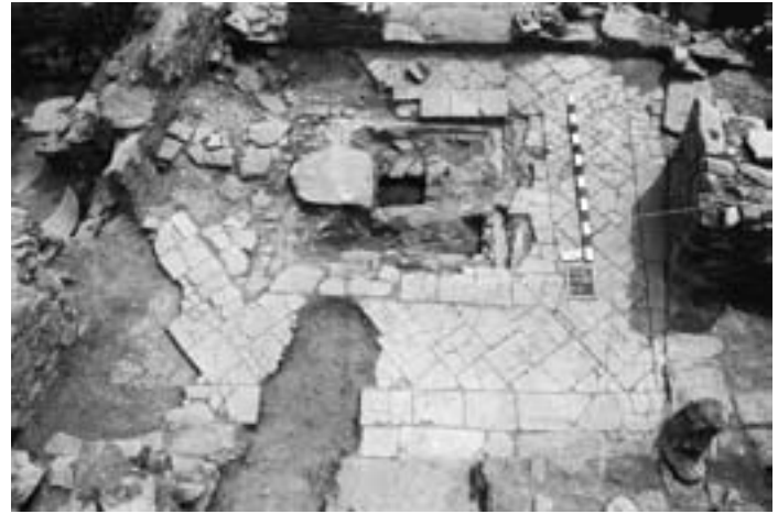
Pavimento em tijoleira – pátio da casa II.

As tijoleiras eram a opção favorita para revestir os pátios (um dos sítios mais importantes no contexto da casa - é óbvio que a escolha da tijoleira tem a ver com o facto de se tratar de um compartimento descoberto e sujeito tanto à acção da chuva como dos raios solares), embora pudessem ser também utilizadas nos anexos das cozinhas (casa I/2) ou até nas latrinas (casa I/4).