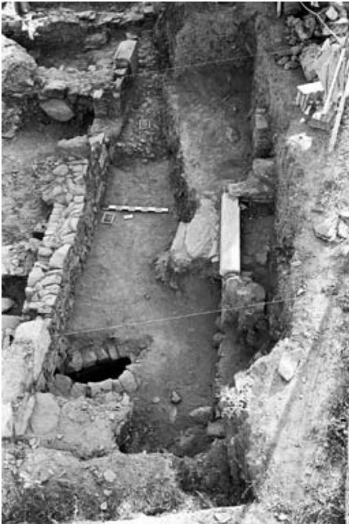
Rua no limite sul do bairro.

Outros autores do período islâmico dedicaram especial atenção à vigilância das ruas, dando indicações precisas sobre a forma de manter a ordem pública, sobre a maneira de utilizar as ruas ou em relação ao modo como os cidadãos se deviam comportar (Arié, 1960: 360-363).