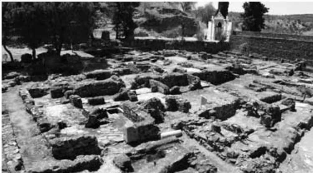
Vista geral do sector oeste do bairro.

Ao todo, e no conjunto das duas ruas, cerca de 86 metros de vias circundavam a área oeste do bairro da alcáçova, numa zona onde as habitações estavam dispostas de modo coerente no aglomerado urbano, de acordo com uma disposição razoavelmente definida e que terá sido traçada antes da construção do bairro. O caso de Mértola parece-nos esclarecedor: o bem organizado sistema de canalizações, fossas, ruas e habitações existentes não é admissível sem a competente presença de um poder capaz de impôr de forma rigorosa o que pretendia. A implantação das casas não é, neste aspecto particular, fruto do improvisado ou de atitudes espontâneas. Parece claro que o conjunto urbano da alcáçova foi fruto de um empreendimento concebido de raiz e que passou pelo delinear do seu traçado, a marcação de ruas e a construção de sistemas de saneamento, existentes antes da edificação das casas. É natural que a menção da palavra “ortogonalidade” possa soar exagerada quando olhamos a planimetria do bairro e constatamos a trama sinuosa do adarve 1, pouco consentânea com um desenho feito a régua e esquadro. Ainda assim, é indesmentível que o desenho do bairro não foi fruto do acaso e que se não podemos falar de um planeamento rigoroso não é menos verdade que podemos, com toda a legitimidade, referir-nos a uma organização urbana pensada e estruturada com algum rigor.