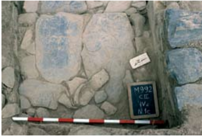
Pavimento em xisto – área de armazenamento da cozinha da casa II.