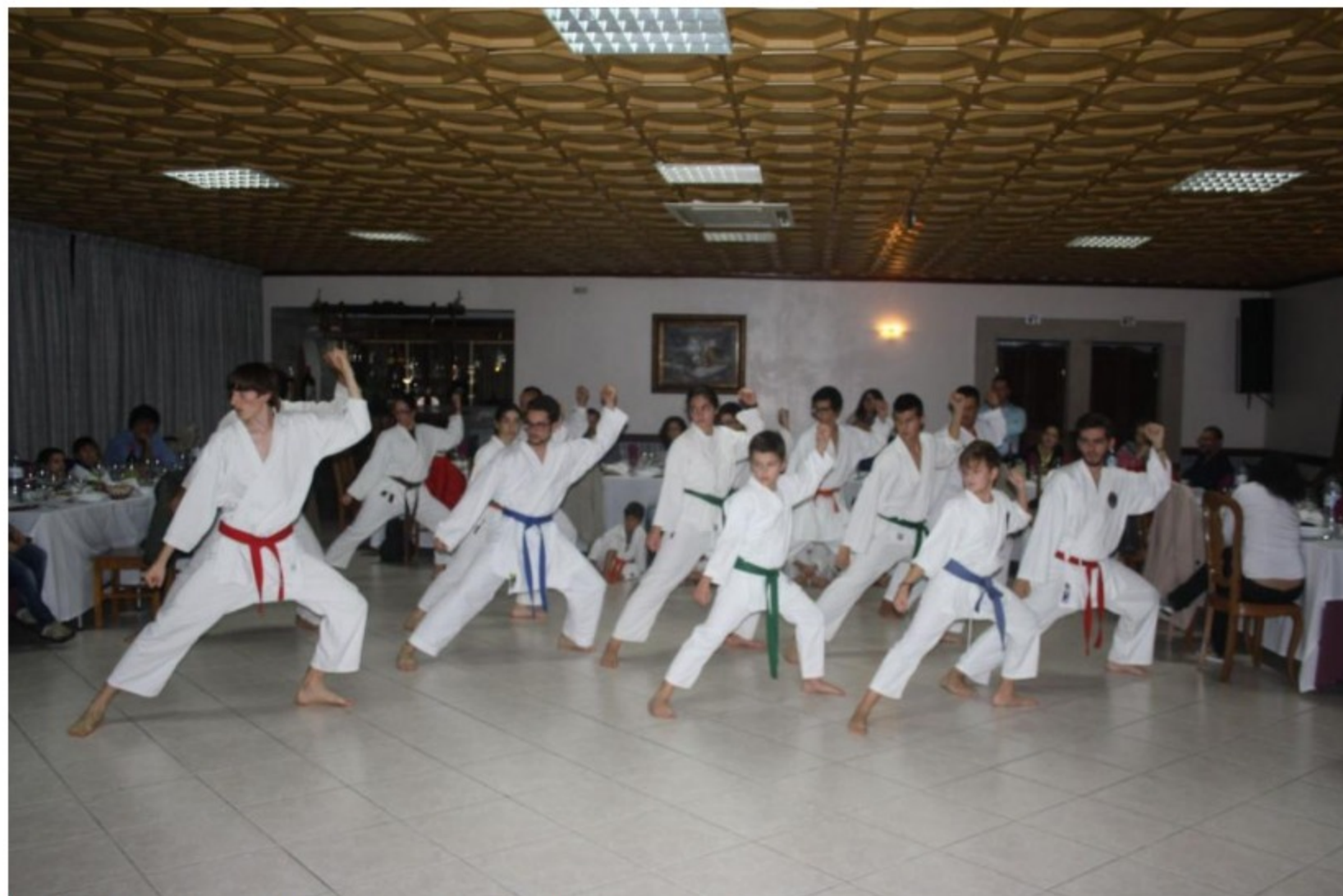
Karaté da Escola Joaquim Salgueiro é uma das modalidades representadas

Quarto ano de Aula Solidária. Desde o ano de 2013 que a Associação de Karaté Wado de Castelo Branco organiza um compacto de atividades que envolvem vários desportos de combate.