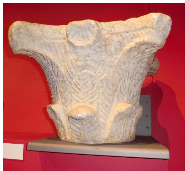
Fig. 4 - Capitel Emiral.

Este aspecto é ainda reforçado pelas fontes árabes que ao referirem o local durante o século IX d.C., designam-no de al-Qasr , denunciado deste modo a existência de um palácio fortificado na zona. Por outro lado, a descoberta de cerâmicas datáveis do período em estudo, encontradas durante as intervenções arqueológicas realizadas na alcáçova, em 1993-97, sob a direcção do IPPAR e da DRCA, e de dois capitéis descobertos na mesma cidade, pertencentes a uma construção palaciana e atribuíveis aos finais do século IX d.C. e inícios do X d.C. (Fig. 4), reforçam a hipótese do al-qasr de planta quadrada com quatro torres nos seus ângulos ter sido edificado nessa altura (Almeida, 1993: 81; Carvalho, Paixão e Faria, 1994: 227; Carvalho e Faria, 1994: 101-102; Leitão, 2016a: 212).