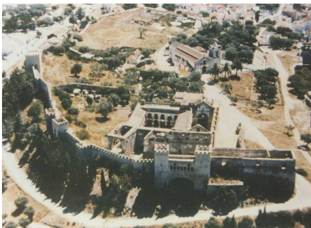
Fig. 1 - Castelo de Alcácer do Sal, 1991 (inventário da D.G.E.M.N.: INV/DGEMN).

Para o caso peninsular, são conhecidas fortificações deste modelo, erguidas no século IX d.C. durante o Período Omíada, como é exemplo a Alcáçova de Mérida, Castelo de El Vacar, na província de Córdoba, Castelo de Guadalerzas, na província de Toledo, Castelo das Relíquias, Castelo Velho de Alcoutim, a primitiva Alcáçova de Silves e a Alcáçova do Castelo de Palmela, também se conhecendo casos para o Norte de África, datáveis do século X d.C., já no Período Califal, como o caso de Ceuta (Soler e Zozaya, 1989: 265; Catarino,