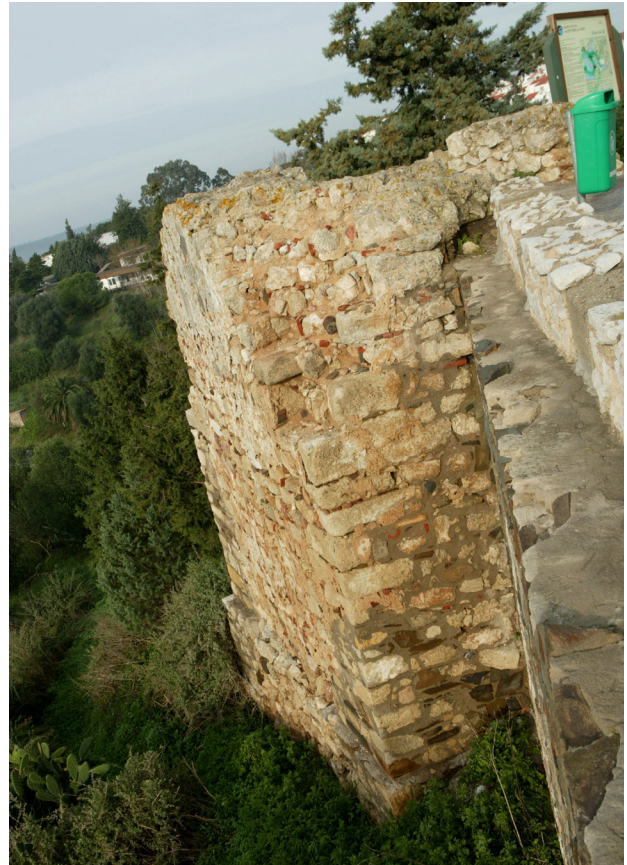
Fig. 7 - Torre da medina datada do século X d.C..

Quanto às estruturas habitacionais e de armazenamento correspondentes ao Período Omíada, foram identificadas no interior do al-qasr , provavelmente edificadas na altura em que aquele foi construído. Entre essas estruturas, importa destacar a descoberta de uma parede com vestígios de estuque, encontrando-se adossada a ela, do lado este, uma lareira ligada a um poço de abertura e secção circular (Fig. 8), com uma profundidade de