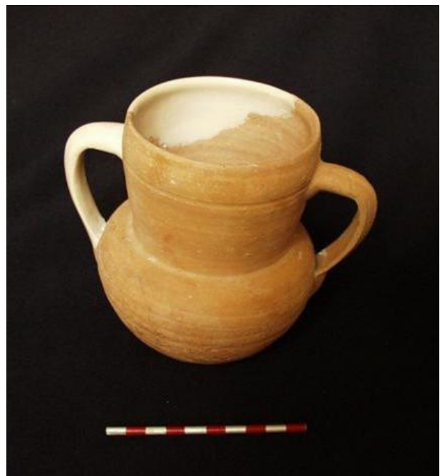
Fig. 14 - Púcaro, séculos IX-X d.C..