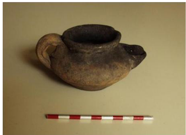
Fig. 13 - Candil, séculos VIII-IX d.C..

cerâmicas produzidas localmente ou regionalmente, sobretudo no que respeita à loiça de cozinha, com formas e temáticas decorativas do Islão, que indicam a existência de fornos de cerâmica na cidade, sendo aqueles já bastante conhecidos no Período Romano ao longo das margens do rio Sado (Faria, 2002: 69). A presença daqueles é ainda atestada no núcleo urbano durante a Idade Moderna, porventura alguns deles poderão datar do Período Muçulmano (Leitão, 2015: 100).