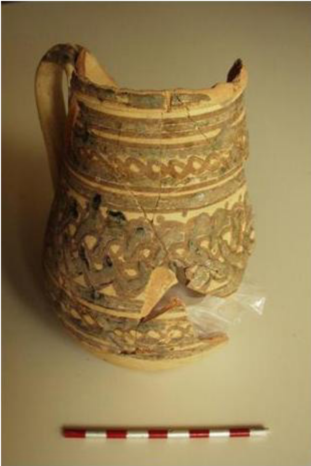
Fig. 17 - Jarro, séculos IX-X d.C. (fotografia de António Rafael Carvalho/ Direcção Regional de Cultura do Alentejo).