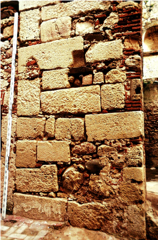
Fig. 3 - Paramento construtivo de uma das torres do al-qasr (cedida pelo Gabinete de Arqueologia da Câmara Municipal de Alcácer do Sal).

da obra, claramente do Período Romano (Fig. 3). Os mesmos foram dispostos em diversas fiadas na horizontal de forma um pouco irregular e afastados entre si, ligados por argamassa, apresentando o sistema de construção em soga e tissão , como se observa nas muralhas omíadas de Mérida, de Cória, de Vascos, do Castelo de Castros em Cáceres e também em uma das torres do Castelo de Palmela que, inclusive, apresenta uma dimensão de 10,2 m × 10,5 m, assemelhando-se à largura da face norte de uma das torres do palácio fortificado de Alcácer com 10,88 m (Fernandes, 2004: 239; Leitão, 2016a: 221).