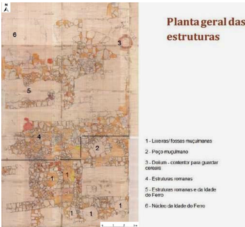
Fig. 10 - Planta geral das estruturas identificadas na zona portuária durante escavações arqueológicas efectuadas na Igreja do Espírito Santo, no ano de 2008, sob a direcção da arqueóloga Marisol Ferreira (desenho de Marisol Ferreira).

2008, sob a direcção da arqueóloga Marisol Ferreira, colocaram a descoberto algumas das suas estruturas. Aquele estaria certamente relacionado com o comércio proveniente do rio, onde habitariam as classes menos abastadas da cidade, nomeadamente os pescadores e outros comerciantes que se dedicavam às actividades portuárias e a alguns ofícios industriais, à semelhança do que se verifica no arrabalde islâmico da Rua dos Correiros em Lisboa (Carvalho, Paixão e Faria, 2001: 207; Bugalhão, Gomes e Sousa, 2007: 318).