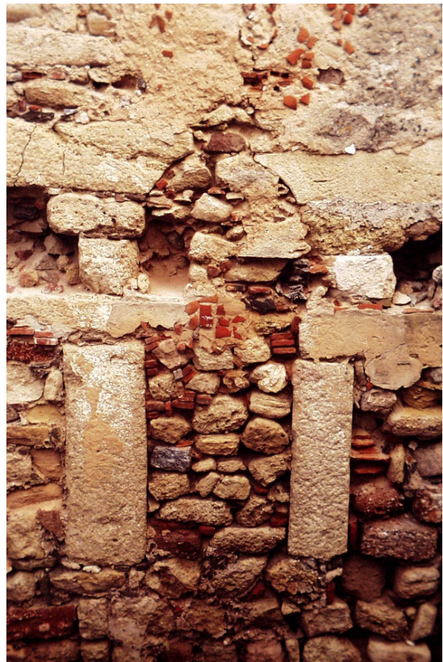
Fig. 2 - Porta de arco ultrapassado.

Na actualidade, apesar das modificações introduzidas na fortaleza ao longo dos séculos, é possível observar ainda o primitivo palácio, assim como uma porta de arco ultrapassado no seu interior que daria acesso a um segundo piso (Figs. 1 e 2). Através da análise minuciosa dos panos e torres de muralha verificou-se que foram reutilizados materiais construtivos provenientes de construções anteriores na sua edificação, nomeadamente elementos arquitectónicos e epigráficos de época romana, assim como silhares de biocalcarenito (matéria-prima presente na região) de grandes dimensões, bem talhados, possuindo ainda as marcas de extracção