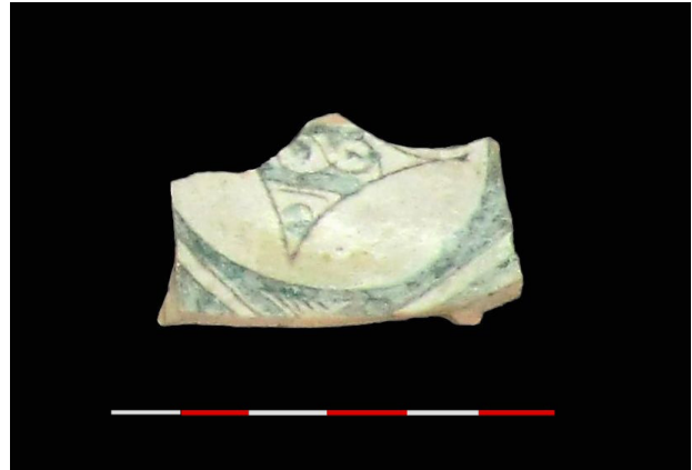
Fig. 15 - Fragmento de taça, século X d.C. (fotografia da autora/ Direção Regional de Cultura do Alentejo).

Um fragmento de taça decorada a verde e manganês tem a representação de uma cruz quadrada ou palmetas e ao centro um cordão da eternidade (Fig. 15). São figurações típicas no repertório cerâmico do século X d.C., devendo-se o exemplar tratar de uma peça importada, possivelmente de Medina-al-Zahra , momento em que a cidade de Alcácer do Sal já se encontrava sob o domínio de Córdova, conforme referem as fontes (Leitão, 2016b: 81). Por outro lado, um fragmento de jarra que apresenta esta mesma técnica decorativa, e para a qual não se encontrou paralelos, poder-se-á tratar de uma produção local ou regional (Fig. 16), quiçá possivelmente, da cidade de Évora, onde existe uma grande coleção de cerâmicas ornamentadas a verde e manganês, denunciando a existência deste tipo de produção na cidade, possivelmente nos finais do Período Califal e, sobretudo, durante os Reinos de Taifas, altura em que aquela conhece um grande desenvolvimento económico (Filipe, 2012: 55; Leitão, 2015: 123).