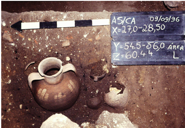
Fig. 9 - Espólio muçulmano in situ identificado no interior de um compartimento no decorrer de intervenções arqueológicas realizadas no Convento de Aracoeli, entre os anos 1993-97, sob a direcção do IPPAR e da DRCA.

Este tipo de construção é característico das edificações iniciais do Período Islâmico (Navarro Palazón e Castillo Jiménez, 1997: 30), tratando-se