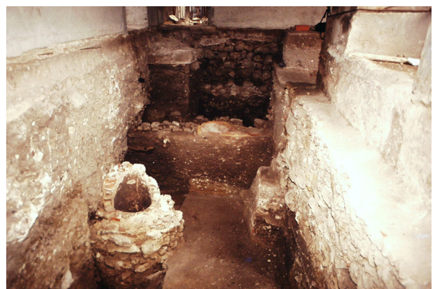
Fig. 8 - Estruturas do Período Emiral identificadas no decorrer de intervenções arqueológicas realizadas no Convento de Aracoeli, entre os anos 1993-97, sob a direcção do IPPAR e da DRCA (fotografia de Manuel Perna cedida pelo Gabinete de Arqueologia da Câmara Municipal de Alcácer do Sal/ Direcção Regional de Cultura do Alentejo).

cerca de 5 metros, edificado em silharia de pedra bem aparelhada, disposta de forma regular e intercalada por fiadas de tijolo e argamassa (Leitão, 2016a: 225).