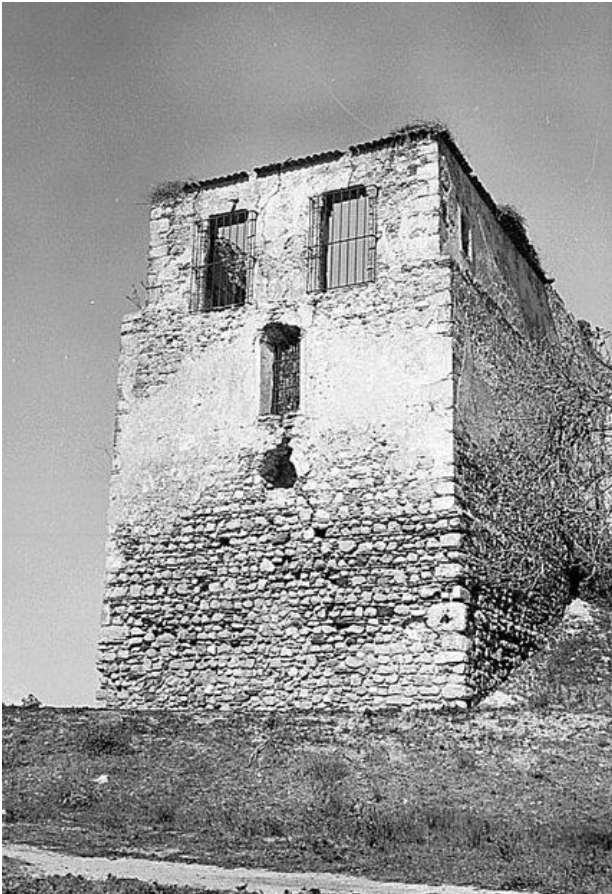
Fig. 6 - Torre da medina de cronologia califal, 1981 (inventário da D.G.E.M.N.: INV/DGEMN).

algumas das torres do Castelo de Palmela datáveis do século X d.C. (Fernandes, 2004: 241; Leitão, 2016a: 213-214).