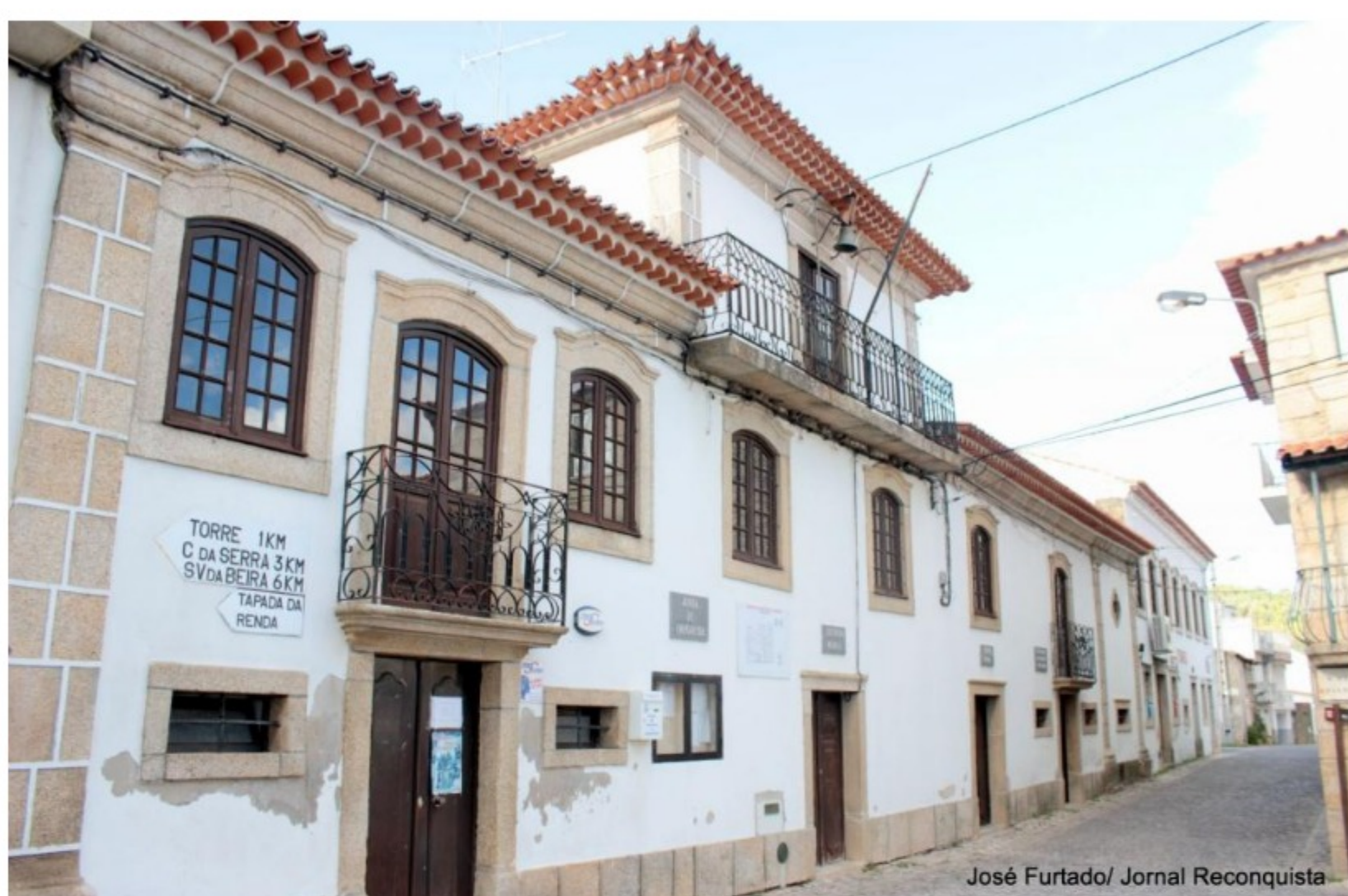
A junta de freguesia queixa-se do serviço de telecomunicações.

A Junta de Freguesia de Louriçal do Campo está insatisfeita com o serviço de telecomunicações prestado pela Portugal Telecom através da Meo.