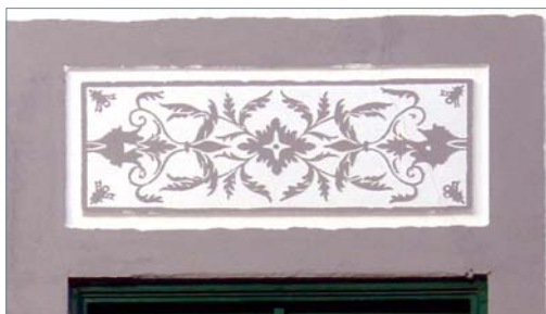
Figura 21: Rua 5 de Outubro, Évora - depois.

exigir a qualificação de profissionais para as executarem.