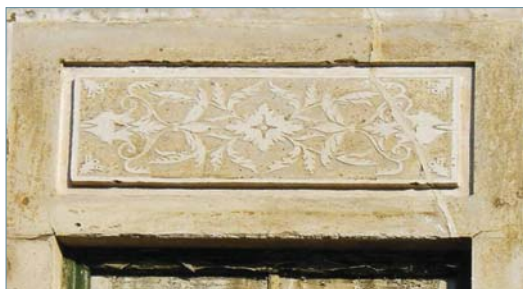
Figura 20: Rua 5 de Outubro, Évora - antes.