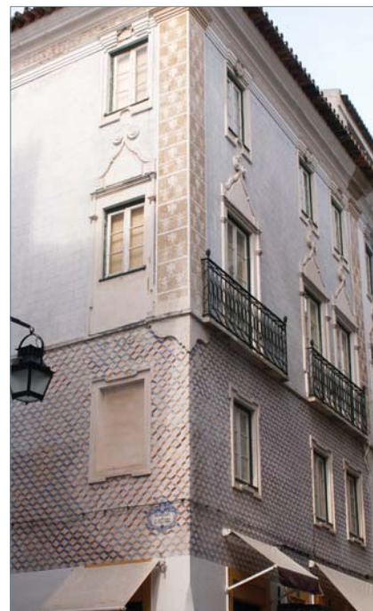
Figura 19: Rua 5 de Outubro, Évora.

Este problema deve ser, também, abordado através da sensibilização de todos os operadores e da população em geral, pois o êxito das intervenções sobre esgrafitos depende não só do conhecimento prévio do objecto e da profundidade desse estudo (projecto de conservação) como também da cultura dos operadores, projectistas e dos urbanistas. Consequentemente, para uma crescente qualificação das intervenções nos esgrafitos, é fundamental não só sensibilizar os vários agentes mas, também,