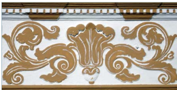
a) > 16